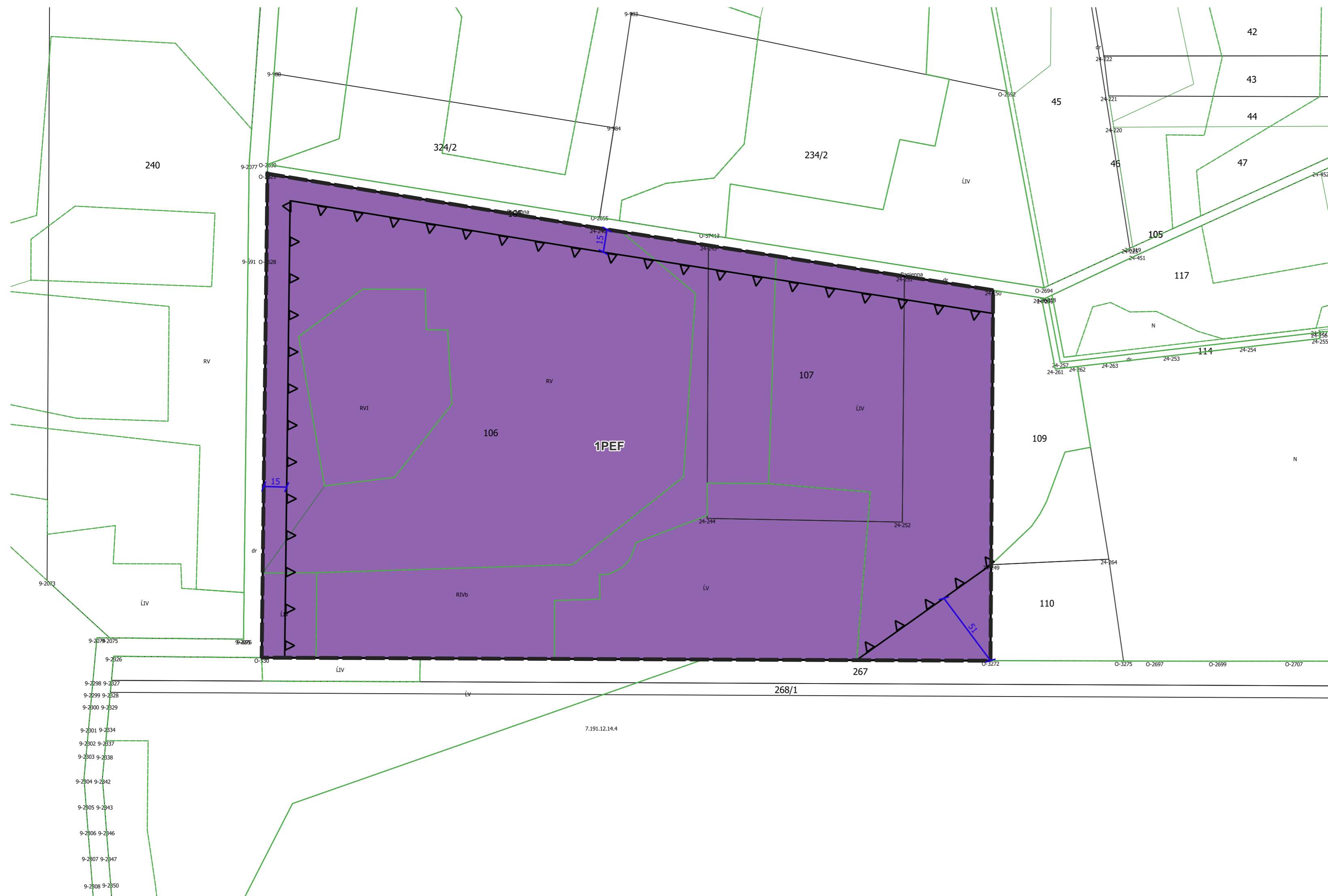
Wyrys ze Studium Uwarunkowań i Kierunków Zagospodarowania Przestrzennego Miasta i Gminy Żuromin