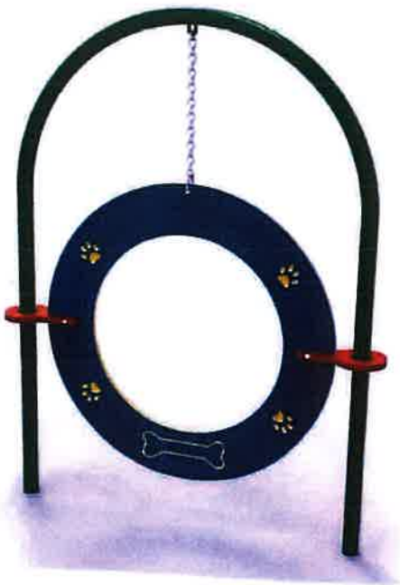
Obręcz do przeskoków z regulacją