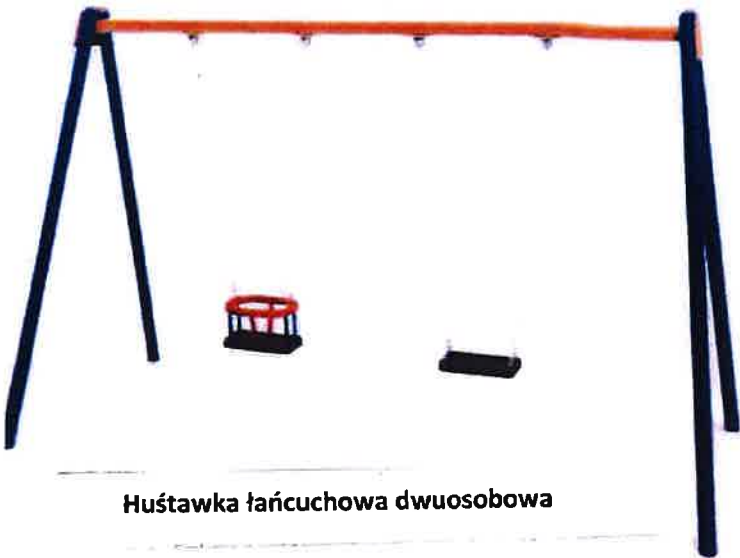
Huśtawka łańcuchowa dwuosobowa