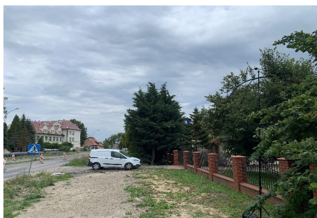
Rysunek 2. Dokumentacja fotograficzna. Widok na punkt pomiarowy oraz widok w kierunku źródła dźwięku