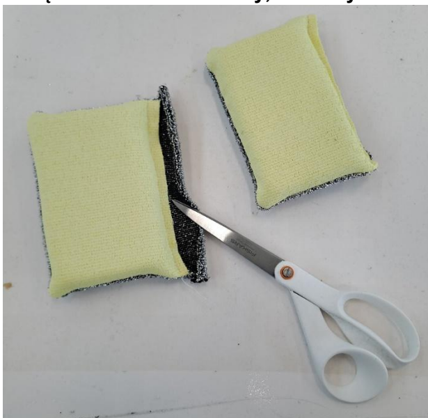
e) kompletowanie zmywaków w pary i banderolowanie