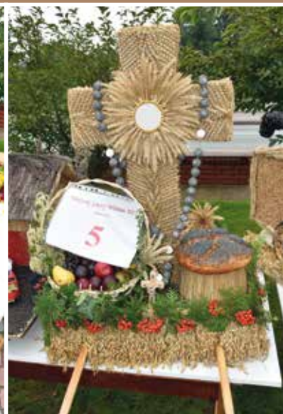
KGW Łupiny Wyróżnienie