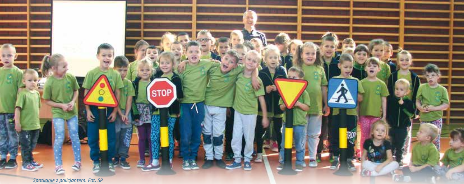
Spotkanie z policjantem.