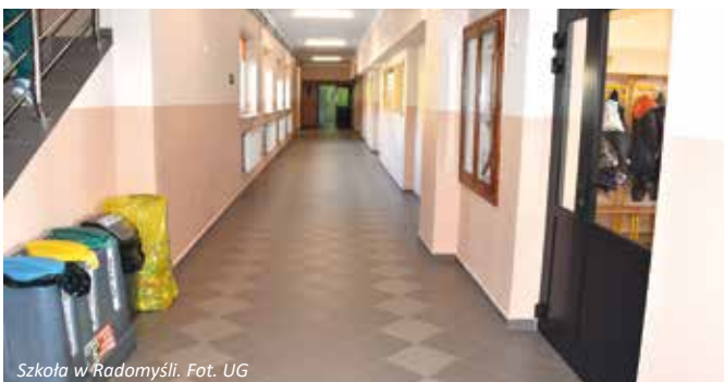
Szkola w Radomyśli.