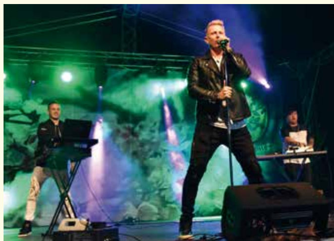
Zespół D-BOMB.