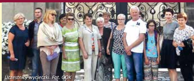
Uczestnicy wycieczki.

Dnia 17 sierpnia 2017 r. odbyła się wycieczka na Jasną Górę zorganizowana przez Gminny Ośrodek Kultury w Wiśniewie. W wycieczce wzięło udział 16 osób. Dziękujemy serdecznie uczestnikom i zapraszamy na kolejne wspólne wyjazdy.