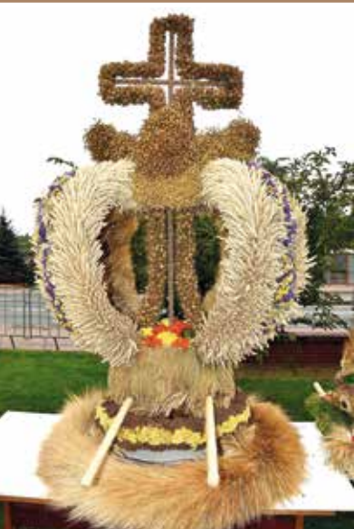
KGW Stare Okniny I miejsce