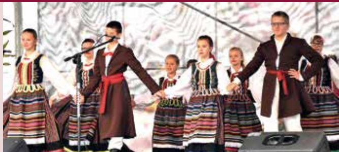
LZPiT Wiśniewiacy.

Gminny Ośrodek Kultury w Wiśniewie zaprasza wszystkich chętnych do zapisów na sekcję muzyczną (nauka gry na keyboardzie i akordeonie) oraz wokalną. Więcej informacji pod numerami telefonów 26 6417 311 i 503 325 683 lub w budynku Gminnego Ośrodka Kultury. Zajęcia prowadzą instruktorzy GOK Wiśniew: Paweł Ksionek, Marek Szczygieł.