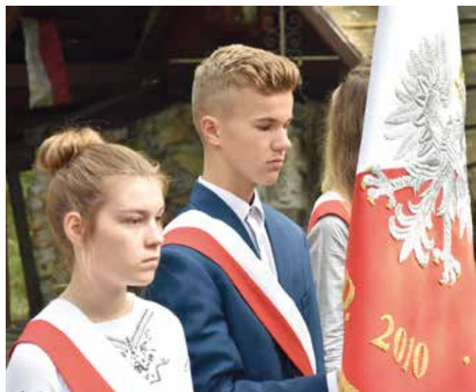
Szkolny poczet sztandarowy pod Dębem straceń.