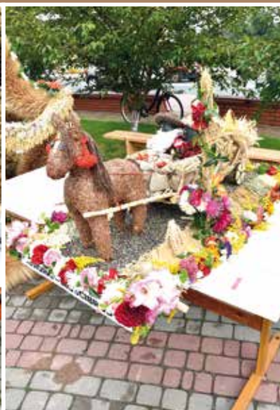
KGW Borki-Kosiorki - Mościbrody Wyróżnienie