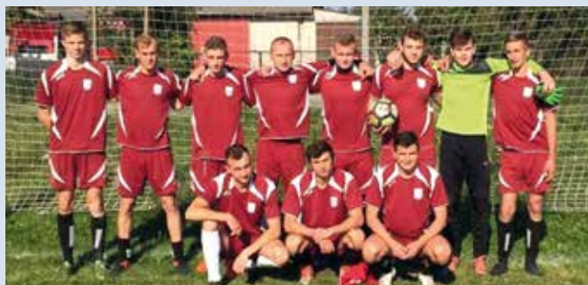
UKS Wisniew.