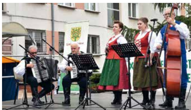
Kapela Ludowa MAZOWSZANIE.