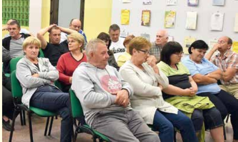
Uczestnicy zebrania.