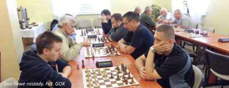
Szachowe rozszady.