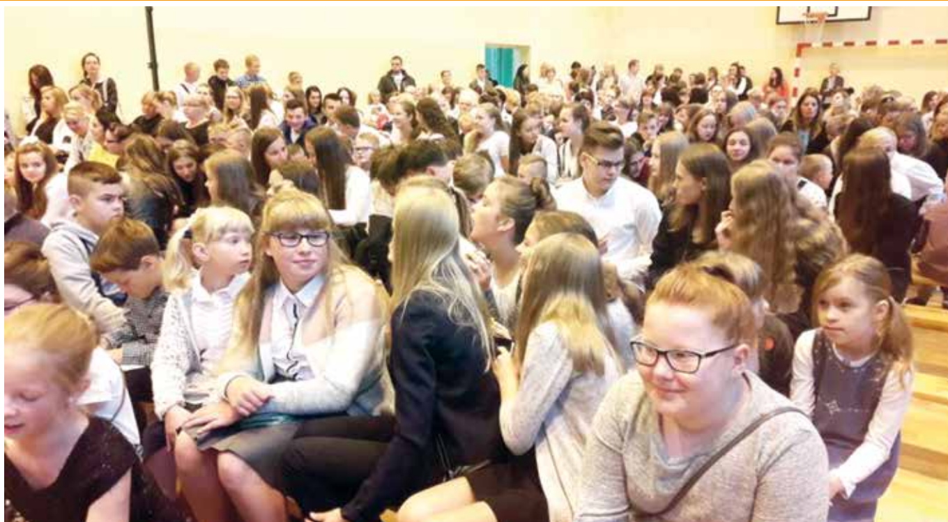
Początek roku szkolnego w ZO Wiśniew.