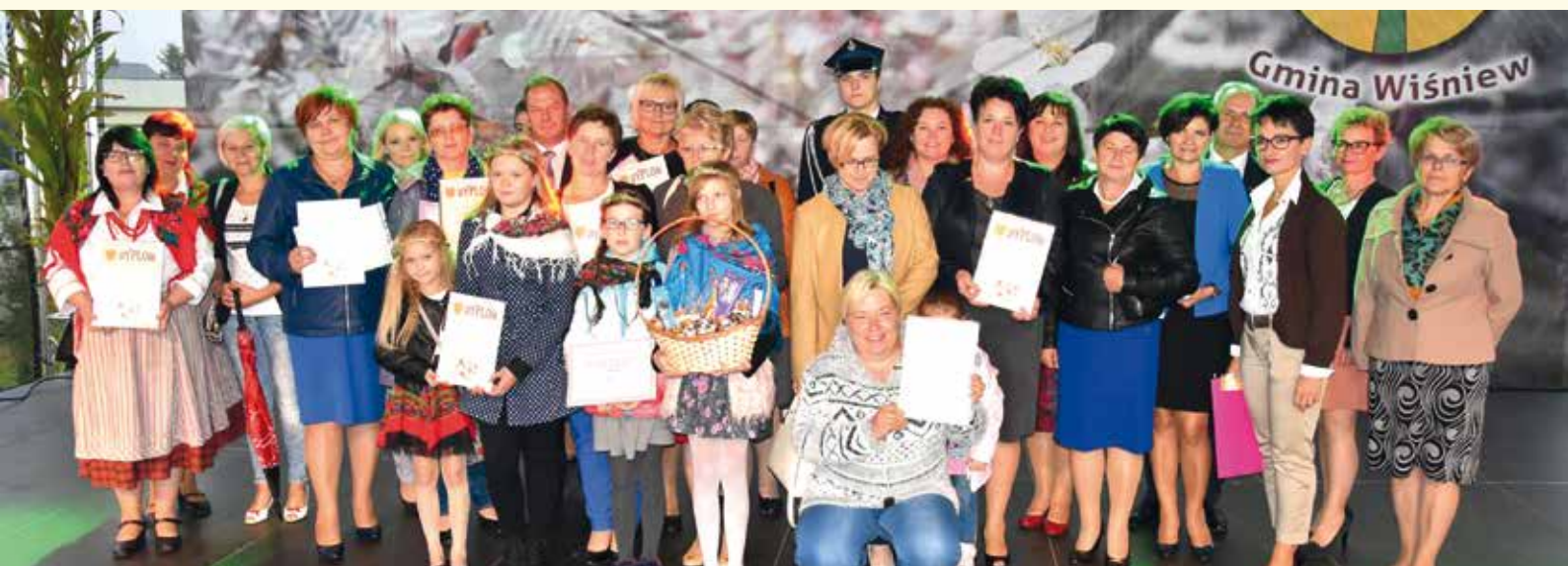
Uczestnicy konkursu na Najładniejszy wieniec dożynkowy.