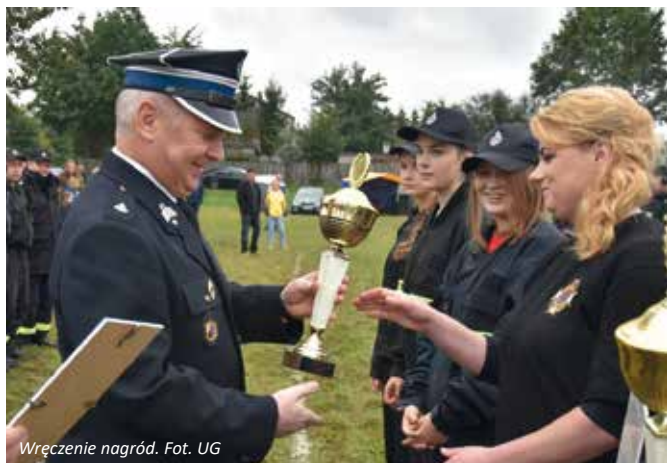
Wręczenie nagród.