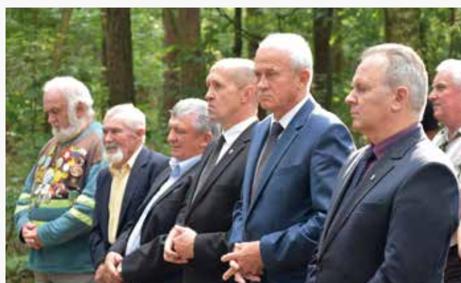
Organizatorzy uroczystości.

Organizowana po raz siódmy uroczystość odbywa się przy tak zwanym „Dębie straceń” na granicy województw mazowieckiego i lubelskiego, powiatów siedleckiego i łukowskiego, a także gmin Wiśniew i Łuków w sąsiedztwie gminy Domanice. Dokładne okoliczności tragedii z czasów Powstania Styczniowego nie są znane. Wiadomo jednak, że w 1863 roku mieszkańcy tych okolic brali