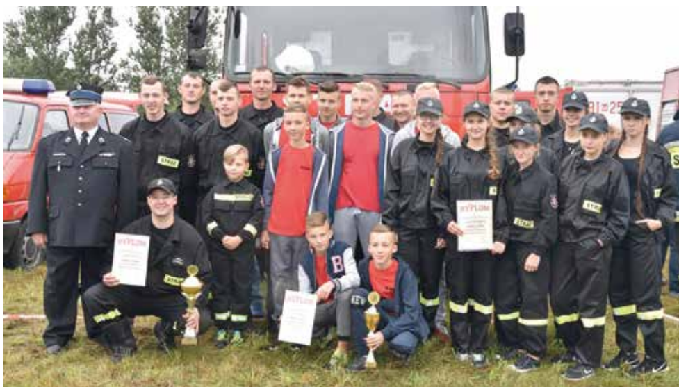
OSP Radomyśl.

W turnieju chłopców zwyciężyła MDP Wiśniew, która wyprzedziła kolegów z MDP z Radomyśli i Łupiny.