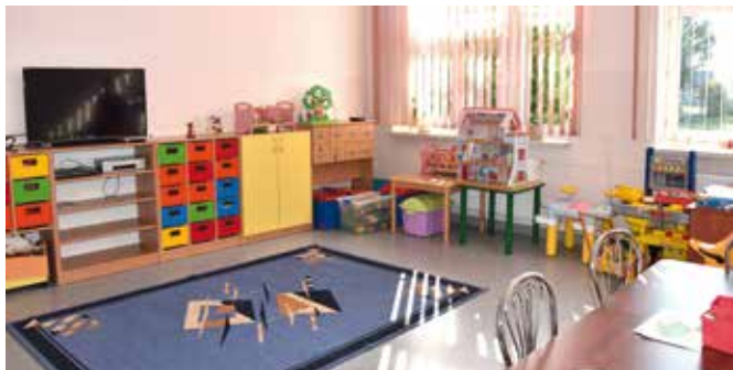
Wyremontowana sala lekcyjna w Śmiarach. Fot. UG

W sierpniu br. zakończyła się przebudowa budynku szkolnego w Śmiarach, polegająca na wyodrębnieniu i utworzeniu części przedszkolnej, rozbudowie o zewnętrzne schody ewakuacyjne w szkole, przeniesieniu biblioteki na I piętro oraz zmianie przeznaczenia zaplecza sali ćwiczeń na salę lekcyjną. Wykonawcą zadania była firma Invest-Ciołek Jarosław ze Starej Wróbliny gm. Łuków. Wartość wykonanych robót to kwota 188.400,00 zł.