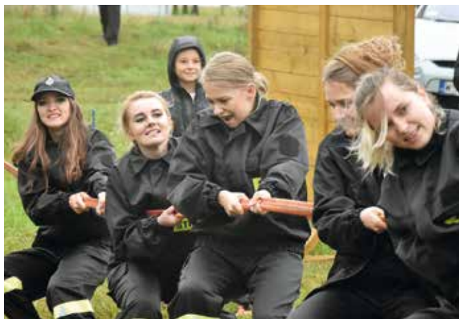
Kobiece OSP Wiśniew.