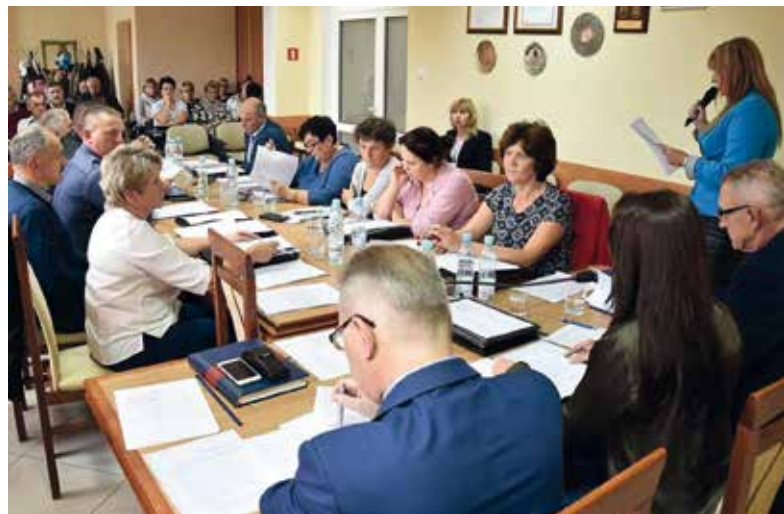
XXXIII Sesja RGW.