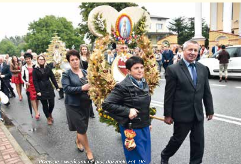
Przejście z wieńcami na plac dożynek.

Po części oficjalnej rozpoczął się program artystyczny. Jako pierwsze na scenie zaprezentowały się dzieci z placówek oświatowych z terenu gminy Wiśniew. Swoboda sceniczna młodych artystów, kolorowe stroje oraz wspaniale dopracowane układy taneczne wyraźnie podbiły serca zgromadzonej publiczności, która oklaskiwała kolejnych wykonawców. Tuż po prezentacji szkół na scenie wystąpiły: Ludowy Zespół Pieśni i Tańca WIŚNIEWIACY im. Zbigniewa Myrchy , Zespół Wokalny RADOŚĆ z Radomyśli oraz Zespół Pieśni i Tańca SOKOŁOWIANIE . Żywiłowy występ grupy z Sokołowa Podlaskiego zachwycił publiczność poziomem artystycznym i pięknymi, tradycyjnymi strojami.