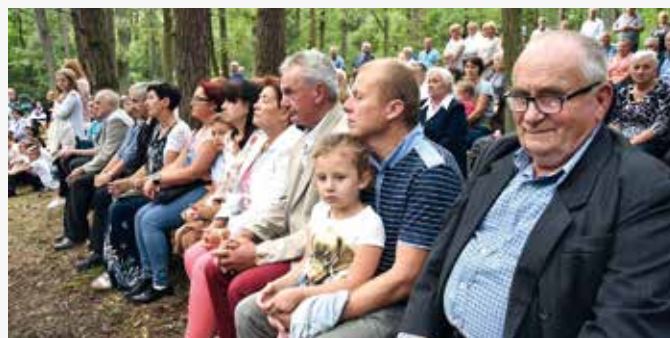
Uczestnicy podczas eucharystii.

m.in. udział w walkach o Łuków, a gdy oddziały carskie zorganizowały skuteczną obronę w miejscowym klasztorze, powstańcy rozpoczęli wojnę partyzancką. Podczas odwrotu po przegranej drugiej bitwie pod Gręzówką, zostali zaatakowani przez wojsko rosyjskie w pobliżu wsi Mroczki. Pojmani wówczas jeńcy, według niektórych źródeł, zostali rozstrzelani, albo powieszani, a miejscem straceń miał być jeden z dębów w Lesie Mroczkowskim.