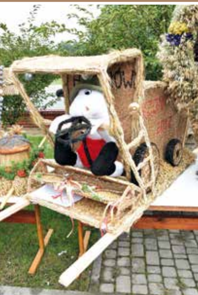
Grupa Dziecięca z Helenowa Nagroda specjalna