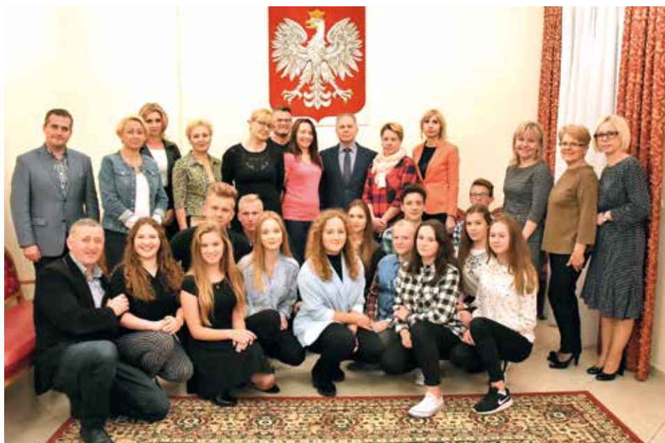
Pamiątkowe zdjęcie.

Serdecznie dziękujemy wszystkim młodym radnym, za minioną kadencję. Życzymy im licznych sukcesów oraz wytrwałości w podejmowaniu nowych inicjatyw dla dobra społeczności lokalnej.