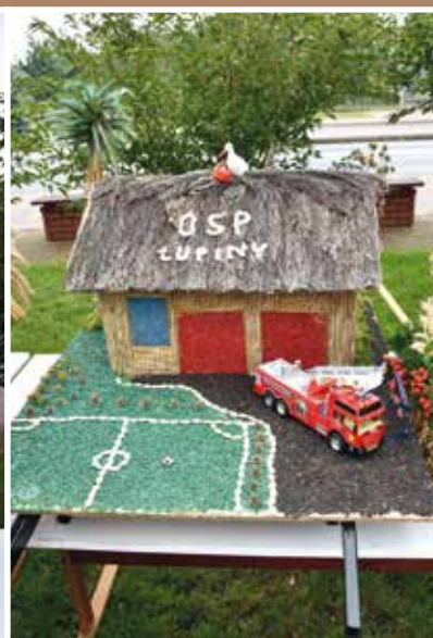
OSP Łupiny Wyróżnienie