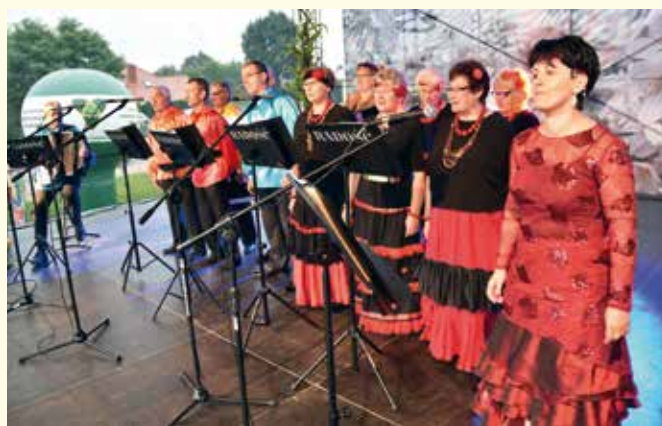
Zespół Wokalny RADOŚĆ z Radomyśli.