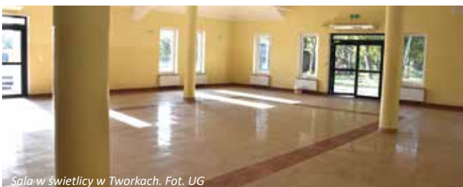
Sala w świetlicy w Tworkach.

Prace budowlane zostały zakończone. Wykonawcą budowy świetlicy była firma Usługi Budowlane Aleksander Bancercz z Wólki Domaszewskiej gm. Wojcieszków. Nowa świetlica ma powierzchnię użytkową 334,46 m 2 i kubaturę 1989,20 m 3 , a koszt jej wybudowania wraz z powierzchnią utwardzoną kostką betonową z miejscami postojowymi dla pojazdów wyniósł 1.086.096,04 zł.