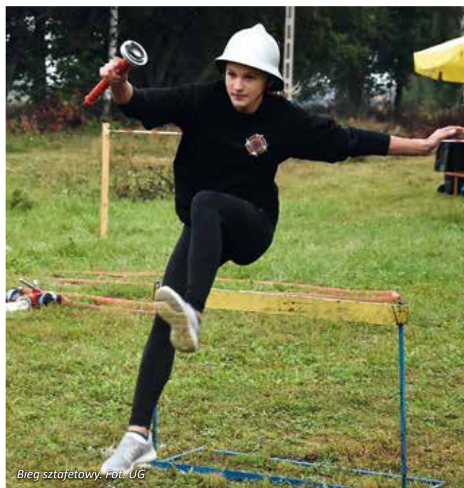
Bieg sztafetowy.