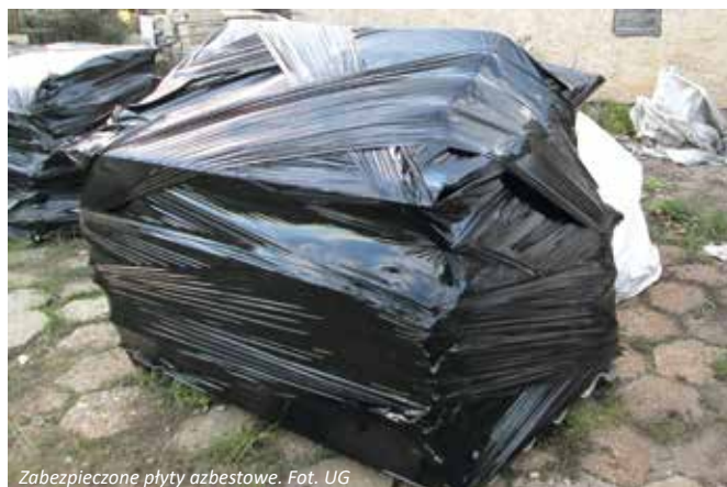
Zabezpieczone płyty azbestowe.

Gmina Wiśniew w maju br. podpisała umowę z Środowisko i Innowacje Sp. z o.o. z Dobrowa na realizację zadania pn.: „Usuwanie i unieszkodliwienie azbestu na terenie gminy Wiśniew w 2017 r.”. W ramach zadania zutylizowanych zostanie 124 tony płyt azbestowo – cementowych z 54 posesji znajdujących się na terenie naszej gminy. Prace związane z odbiorem i utylizacją potrwać do 20 października 2017 r. Gmina Wiśniew pozyskała dofinansowanie na realizację powyższego zadania z Wojewódzkiego Funduszu Ochrony Środowiska i Gospodarki Wodnej w Warszawie. Kwota przyznanej dotacji wynosi 35.634 zł. Przypominamy jednocześnie, że w sposób ciągły trwają zapisy osób, które chcą zgłosić eternit do utylizacji w przyszłym roku. Zainteresowanych zapraszamy do urzędu gminy do pok. 17 w godzinach pracy urzędu.