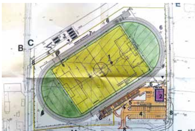
Projekt boiska.

W marcu br. Gmina Wiśniew złożyła wniosek do Ministra Sportu i Turystyki o dofinansowanie zadania pn.: „Budowy boiska piłkarskiego w Wiśniewie, gm. Wiśniew” z Programu Rozwoju Szkolnej Infrastruktury Sportowej 2017. Wniosek został rozpatrzone pozytywnie. Dnia 12 sierpnia podpisaliśmy umowę z MSiT w Warszawie na zadanie, na które dostaliśmy dofinansowanie w wysokości 1 387 500 zł. Całkowity koszt inwestycji został wyceniony na 3 420 904 zł. Dzięki inwestycji powstanie pełnowymiarowe boisko trawiaste z bieżnią, trybunami, szatnią, drogami i placami wewnętrznymi, oświetleniem oraz ogrodzeniem. Rozpoczęcie prac jeszcze w tym roku, a planowane zakończenie w 2019 r.