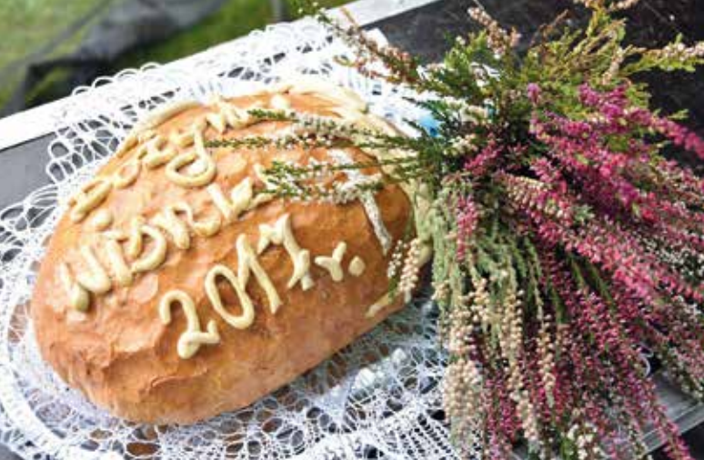
Chleb dożynkowy.