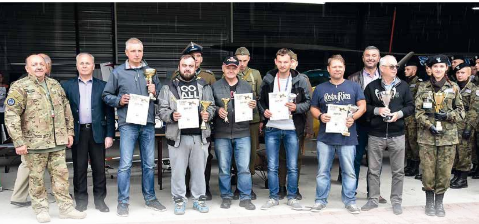
Zwycięzcy zawodów.