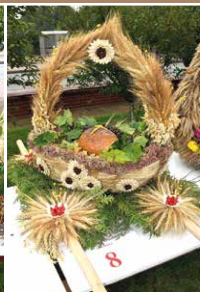
Mieszkańcy Nowych Oknin Wyróżnienie