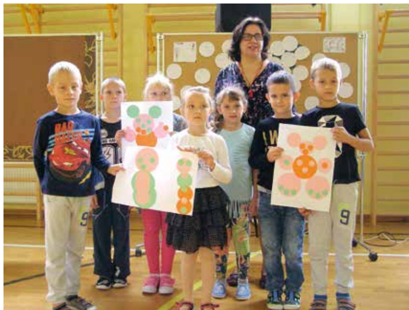
Dzień Kropki.