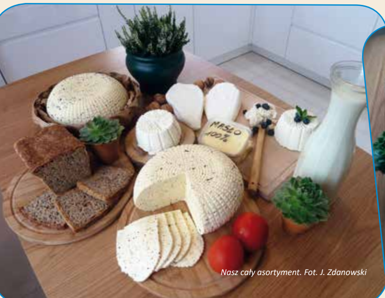
Nasz cały asortyment.

JZ: Tak. Jak najbardziej. Obserwujemy coraz większe zainteresowanie naszymi produktami. Wiele osób przyjeżdża do nas i pyta o sery, oraz chwali je w swoim środowisku. Klienci chętnie do nas wracają i przyprowadzają swoich znajomych.