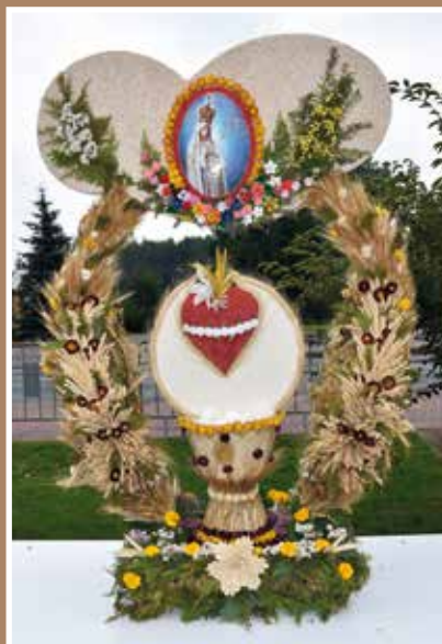
KGW Śmiary Wyróżnienie