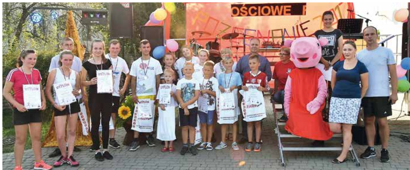
Uczestnicy biegu.