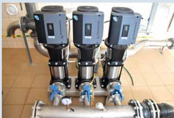
Urządzenia na SUW Wiśniew.