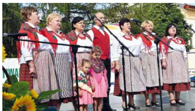
ZL WIŚNIEWIACY im. Z. Myrchy.