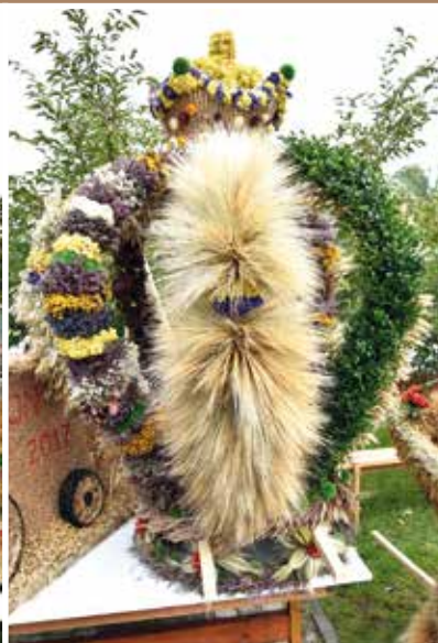
KGW Helenów II miejsce