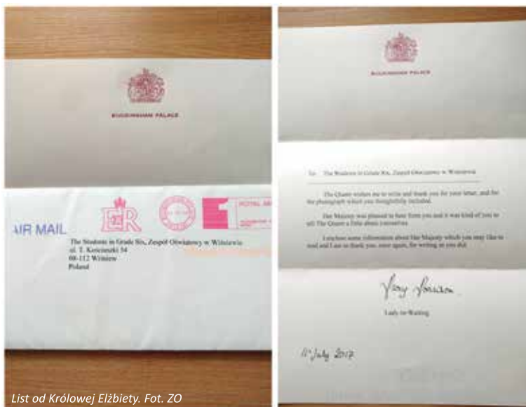
List od Królowej Elżbiety.

Informacje przygotowała Renata Godzińska