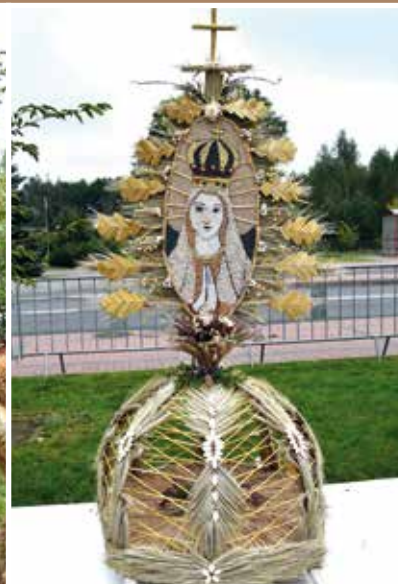
Mieszkańcy Wiśniewa III miejsce