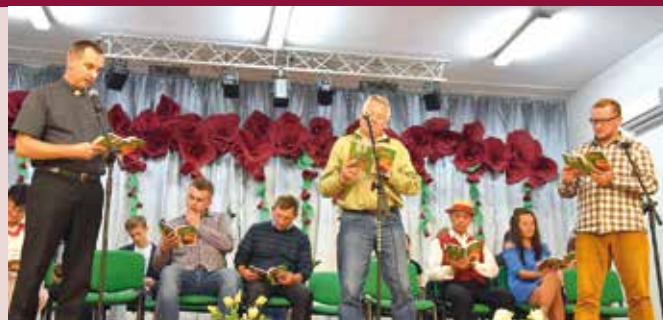
Uczestnicy narodowego czytania.

W sobotę 2 września na terenie całego kraju odbył się finał akcji „Narodowe czytanie”. W tym ogólnopolskim wydarzeniu udział wzięła się również Gminna Biblioteka Publiczna w Wiśniewie.