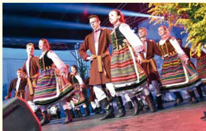
ZPIT SOKOŁOWIANIE.