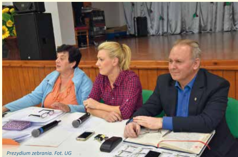
Przydziom zebrania.