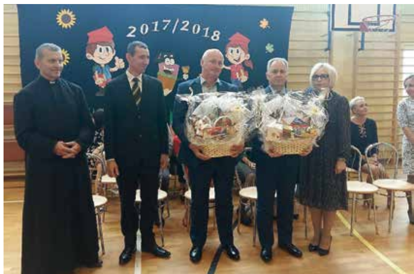
Początek roku szkolnego.