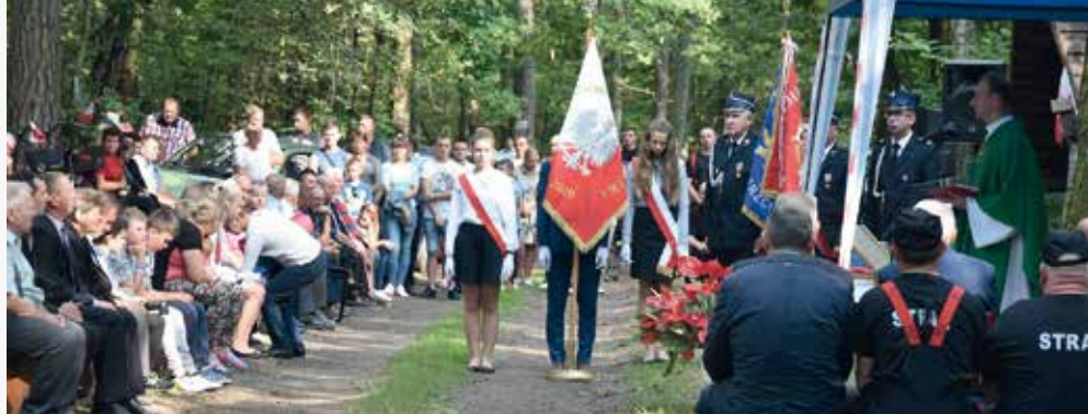
Msza polowa.