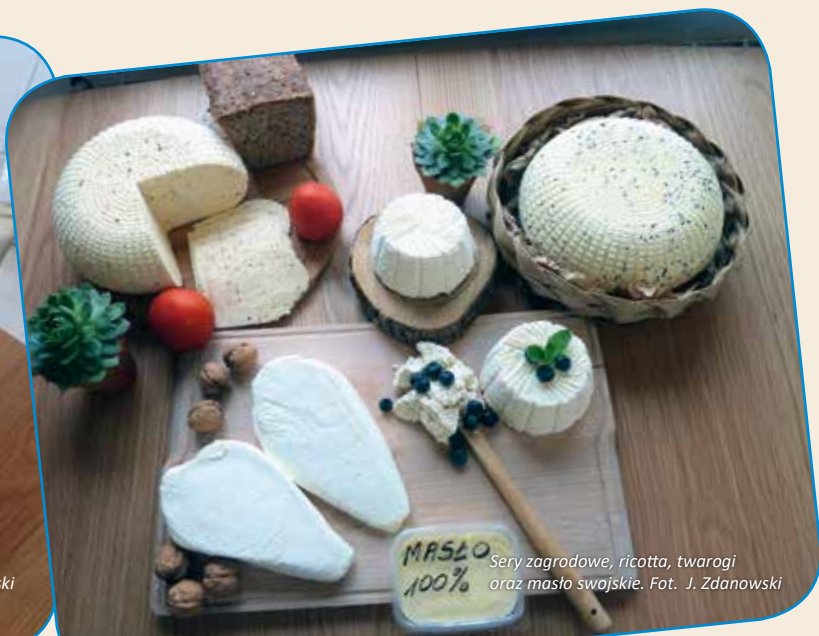
Sery zagrodowe, ricotta, twarogi oraz masło swojskie.