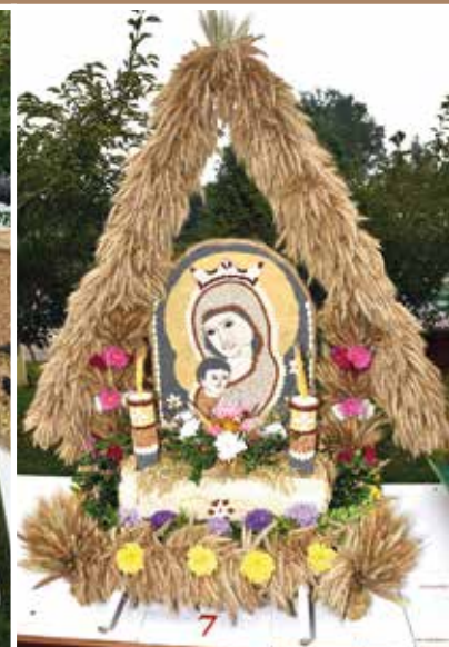
KGW Mroczyki Wyróżnienie