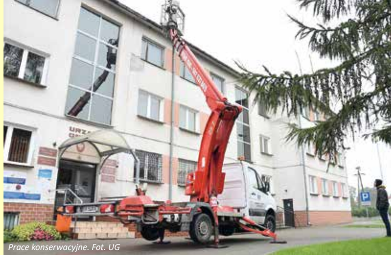
Prace konserwacyjne.