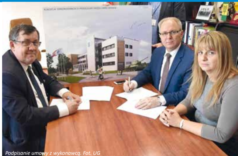
Podpisanie umowy z wykonawcą.

W marcu br. Gmina Wiśniew złożyła wniosek do Ministra Sportu i Turystyki o dofinansowanie zadania pn.: „Budowy boiska piłkarskiego w Wiśniewie, gm. Wiśniew” z Programu Rozwoju Szkolnej Infrastruktury Sportowej 2017. Wniosek został rozpatrzone pozytywnie. Dnia 12 sierpnia podpisaliśmy umowę z MSiT w Warszawie na zadanie, na które dostaliśmy dofinansowanie w wysokości 1 387 500 zł. Całkowity koszt inwestycji został wyceniony na 3 420 904 zł. Dzięki inwestycji powstanie pełnowymiarowe boisko trawiaste z bieżnią, trybunami, szatnią, drogami i placami wewnętrznymi, oświetleniem oraz ogrodzeniem. Rozpoczęcie prac jeszcze w tym roku, a planowane zakończenie w 2019 r.