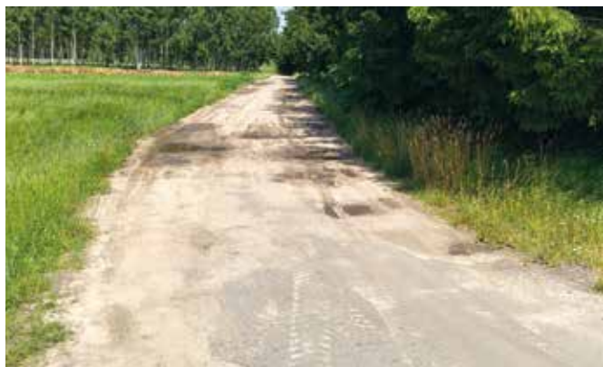
Droga w Helenowie.

W dniu 3 sierpnia br. w Urzędzie Marszałkowskim Województwa Mazowieckiego w Warszawie podpisaliśmy umowę o udzielenie dotacji ze środków związanych z wyłączeniem z produkcji gruntów rolnych pn.: „Przebudowa drogi dojazdowej do gruntów rolnych w Helenowie”. Inwestycja polega na wykonaniu nawierzchni tłuczniowej na powierzchni 3 927,5 m 2 i długości 730 m. W drodze przetargu nieograniczonego wybrany został wykonawca robót - F.H.U. Marcin Prokurat, który zaoferował wykonanie zadania za kwotę 171 002,6 zł, z czego wg podpisanej umowy, Urząd Marszałkowski dofinansuje 50 % zadania, tj. około 85 000 zł. Termin wykonania prac to 31 października br.