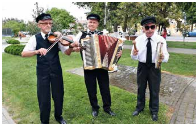
Kapela MAZOWSZAKI.