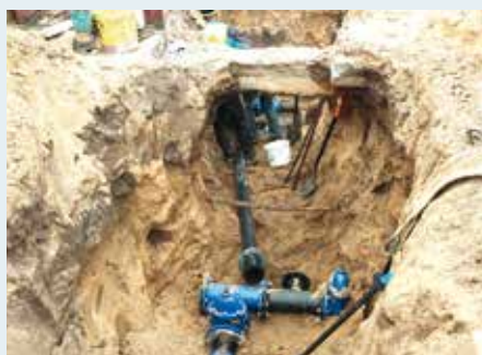
Przyłącze wodociągowe.

Po otrzymaniu warunków przyłączenia wydanych przez administratora sieci wodociągowej w tym przypadku Wójta Gminy Wiśniew inwestor zobowiązany jest zlecić wykonanie projektów przyłączy u projektanta z odpowiednimi uprawnieniami budowlanymi w branży sanitarnej. Projekt oraz plan sytuacyjny przyłącza wodociągowego czy kanalizacyjnego należy uzgodnić