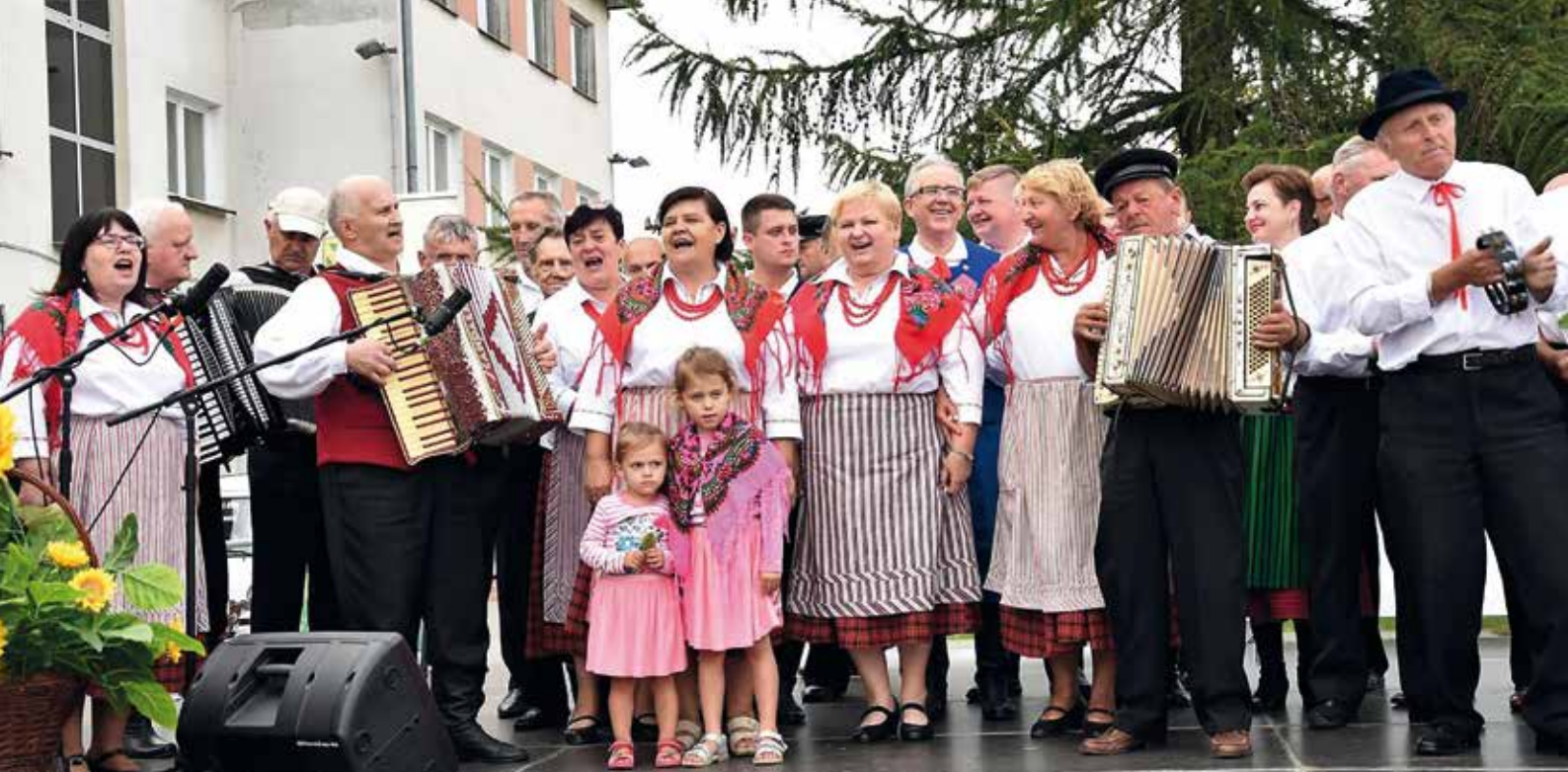
Finałowa Polka Wiśniewska.