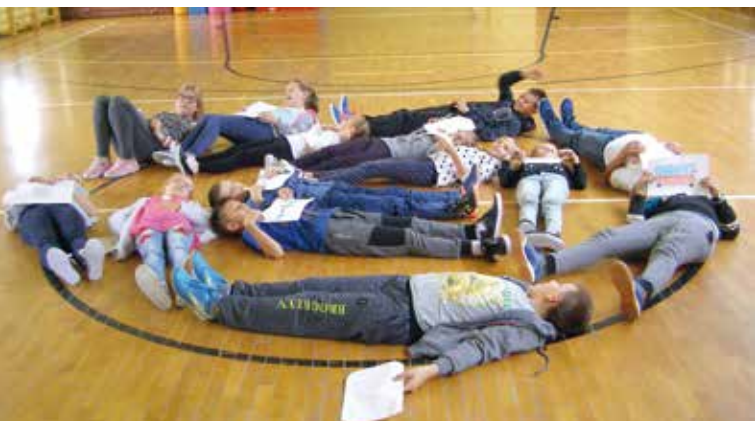
Dzień Kropki.