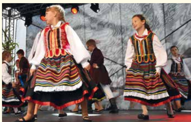
LZPIT WIŚNIEWIACY. Fot. UG

W dalszej części uroczystości na scenę zostali zaproszeni rolnicy, którzy otrzymali nadawaną przez Ministra Rolnictwa i Rozwoju Wsi - Odznakę honorową „Zasłużony dla rolnictwa”. Kapituła w bieżącym roku wytypowała pięciu rolników z terenu gminy Wiśniew. Wójt zgodnie z rekomendacją przygotował wnioski do Ministra