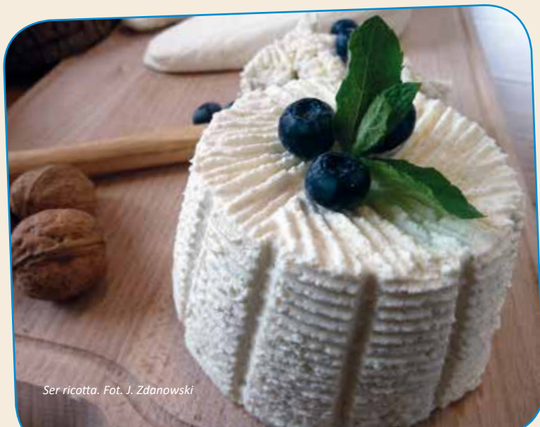
Ser ricotta.