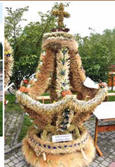
KGW Daćbogi - Pluty III miejsce