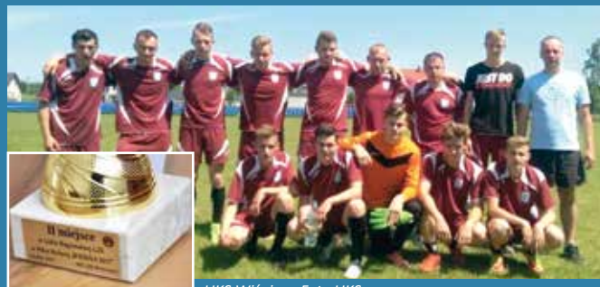
UKS Wiśniew.

Dobiegły końca rozgrywki Ligi Regionalnej LZS w piłce nożnej „Wiosna 2017”. Po 5 kolejkach drużyna UKS Wiśniew zajęła drugie miejsce, zdobywając srebrny medal.