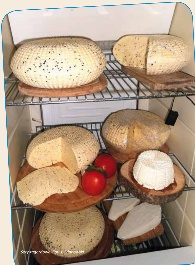
Sery zagrodowe.