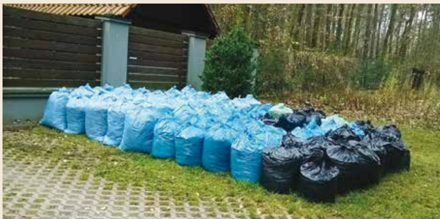
Worki z liśćmi

Co w temacie grabienia liści na jesieni - przypomnijmy sobie