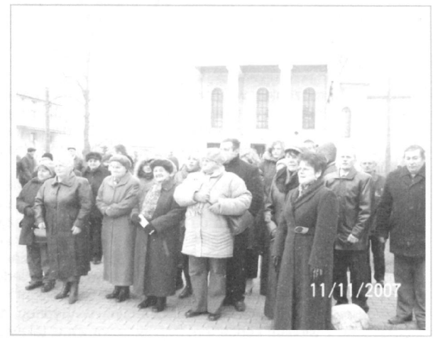
Na placu przed pomnikiem.

- Tegoroczna rocznica odzyskania niepodległości przebiegła na terenie naszej gminy godnie i uroczyście. Dziękuję wszystkim mieszkańców, którzy w tym dniu przyłączyli się do świątecznego nastroju, dekorując swoje domy narodowymi barwami. Dziękuję również szkołom, zakładom pracy za wywieszenie flag państwowych, które zaakcentowały w tym szczególnym dniu naszą państwowość oraz przywiązanie i szacunek do barw narodowych – powiedział wójt gminy Wiśniew - Krzysztof Kryszczuk.