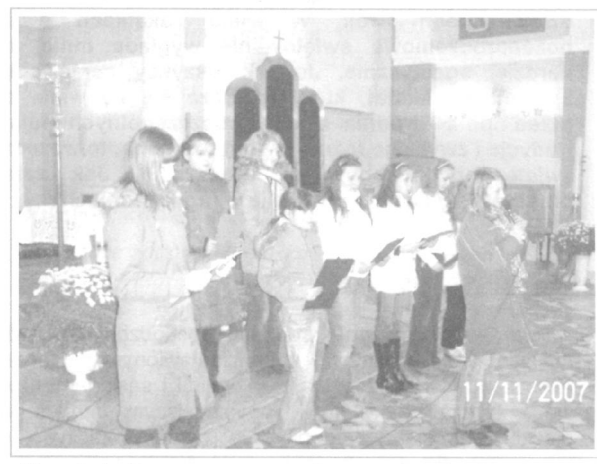
Montaż słowno – muzyczny w wykonaniu uczniów Gimnazjum Publicznego w Wiśniewie.