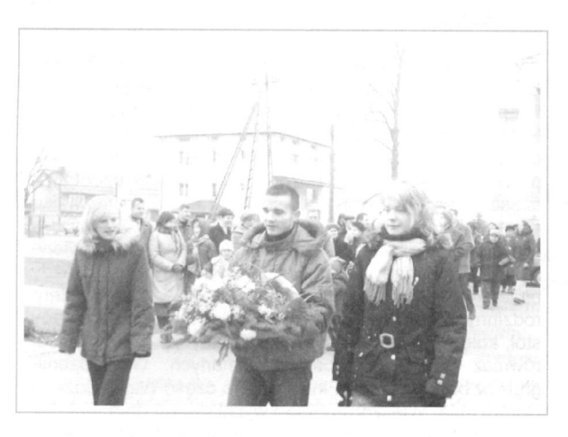
Młodzież składa wiązanki kwiatów pod pomnikiem "legionowym".

Dzień 11 listopada ustanowiono świętem narodowym dopiero ustawą z kwietnia 1937 roku, czyli prawie 20 lat po odzyskaniu niepodległości. Narodowe Święto Niepodległości przywrócono ustawą sejmową w 1989 roku. Jest to jedno z najważniejszych świąt państwowych w niepodległej Polsce.