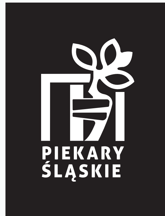
WERSJA MONOCHROMATYCZNA BIAŁA