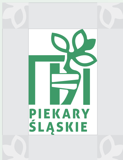
LOGO W POLU OCHRONNYM