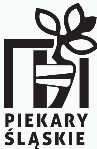
WERSJA MONOCHROMATYCZNA CZARNA