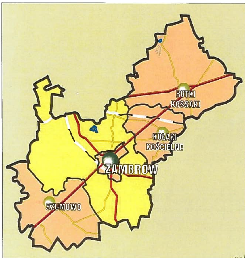
Rys. 1 Gmina Zambrów na tle powiatu zambrowskiego

W bezpośrednim sąsiedztwie znajdują się gminy: Kołaki Kościelne, Rutki, Łomża, Śniadowo, Szumowo, Andrzejewo, Czyżew Osada, Wysokie Mazowieckie oraz gmina miejska Zambrów. Sieć osadnicza liczy 72 miejscowości, w tym 71 sołectw.