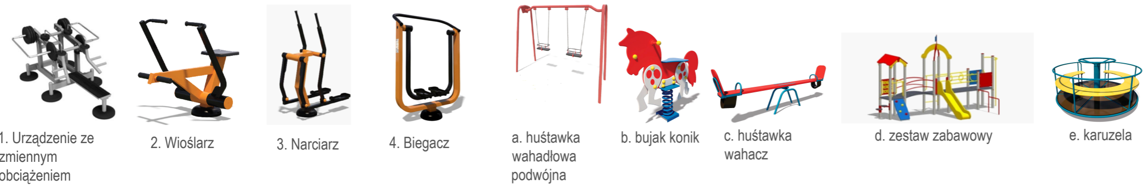
1. Urządzenie ze zmiennym obciążeniem 2. Wioślarz 3. Narciarz 4. Biegacz a. huśtawka wahadłowa podwójna b. bujak konik c. huśtawka wahacz d. zestaw zabawowy e. karuzela