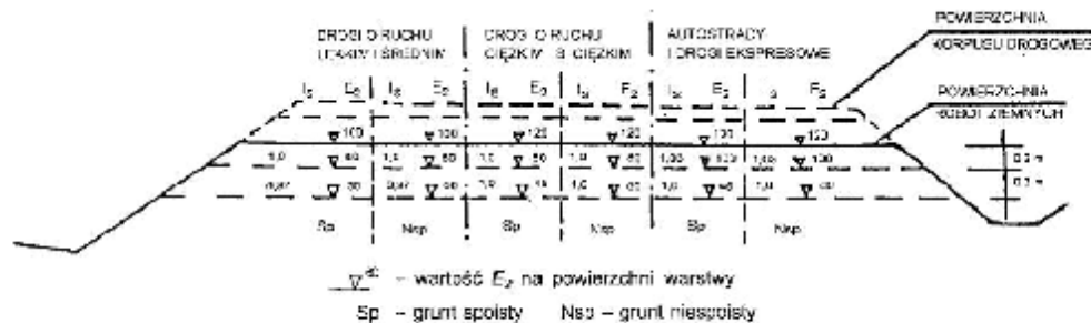
Rysunek 4 – Wartości wymagane w podłożu wykopów: wskaźnika zagęszczenia I_s i wtórnego modułu odkształcenia E_2 , megapaskali

Dodatkowo można sprawdzić nośność warstwy gruntu na powierzchni robót ziemnych na podstawie pomiaru wtórnego modułu odkształcenia E_2 zgodnie z PN-02205:1998 [4] rysunek 4.