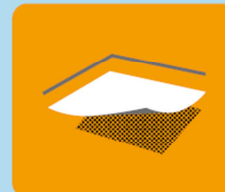
Strop nad nieogrzewaną piwnicą, podłoga na gruncie