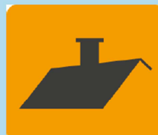
Dach lub strop