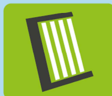
OZE: mikroinstalacje fotowoltaiczne i kolektory słoneczne