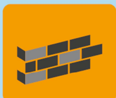
Ściany zewnętrzne oraz wewnętrzne, oddzielające pomieszczenia ogrzewane od nieogrzewanych