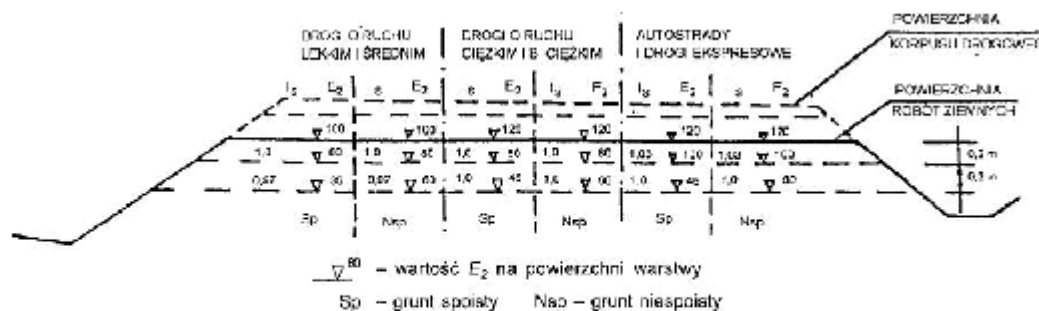
Rysunek 4 – Wartości wymagane w podłożu wykopów: wskaźnika zagęszczenia I_s i wtórnego modułu odkształcenia E_2 , megapaskali

Dodatkowo można sprawdzić nośność warstwy gruntu na powierzchni robót ziemnych na podstawie pomiaru wtórnego modułu odkształcenia E_2 zgodnie z PN-02205:1998 [4] rysunek 4.