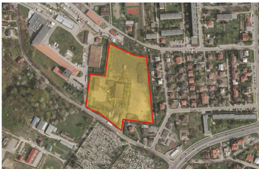
Rysunek nr 2 – Fragment mapy lotniczej – lokalizacja Zakładu Ciepłowniczego w Sanoku