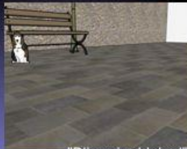
"Bliscy i oddaleni"

jest taka miłość która nie umiera choć zakochani uciekną od siebie porzucona jak pies samotna wierna nawet niewiernym na spacerze w niebie