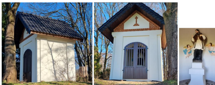
Fotografia 7. Widok na kapliczkę św. Jana Nepomucena w Łanach Wielkich.

Kapliczka jest objęta ochroną poprzez wpis do rejestru zabytków. W ostatnich latach przeprowadzono renowację kapliczki. Stan techniczny – bardzo dobry.