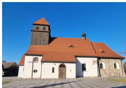
Fotografia 2. Widok na kościół pw. Św. Mikołaja w Kozłowie.