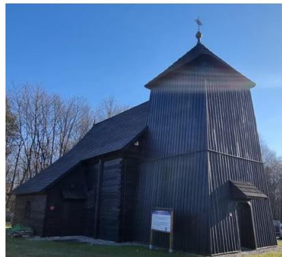
Fotografia 4. Widok na kościół pw. Św. Bartłomieja w Smolnicy.