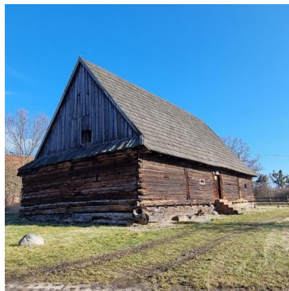
Fotografia 8. Widok na spichlerz drewniany w Rachowicach.

Jest to obiekt wolnostojący, drewniany, wzniesiony w konstrukcji mieszanej, tj. sumikowo-łątkowej w ścianach podłużnych oraz zrębowej w ścianach szczytowych, z podwaliną na peckach. Charakteryzuje się typową, prostopadłościenną, jednopiętrową bryłą zwieńczoną wysokim, krytym gontem dachem