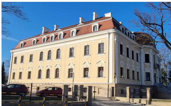
Fotografia 1. Widok na pałac w Sośnicowicach.

Budynek późnobarokowy, z dekoracją w stylu regencji i wczesnego rokoka. Wzniesiony na rzucie litery C, dwukondygnacyjny, wysoko podpiwniczony nakryty mansardowymi dachami z rzędami lukarn. Na osi elewacji frontowej korpusu prostokątny ryzalit o zaoblonych narożach, poprzedzony tarasem z dwoma przeciwległymi biegami wachlarzowych schodów - całość ujęta balustradą z murem tralek. Elewacje rozczłonkowane pilastrami jońskimi w porządku wielkim, z podziałami ramowymi i płycinowymi. podziałami ramowymi. W elewacjach frontowych partia piwnic wydzielona wyładowanym gzymsem cokołowym. Otwory okienne – prostokątne i zamknięte łukiem koszowym ramowane ornamentem regencyjnym rozbudowanym w nadprożach, na parterze zwieńczonych łukowymi odcinkami gzymsu. W dekoracji motywy listew, konsoli, muszli i kampanulli. Na cokole jednego z pilastrów od strony dziedzińca kamienna tablica z nazwiskami budowniczych Andres Stephan i Andres Wagner, 1755 r. W wnętrzu: sala balowa o