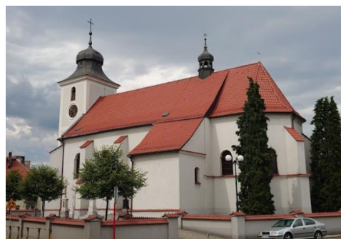
Fotografia 6. Widok na kościół pw. Św. Jakuba w Sośnicowicach.