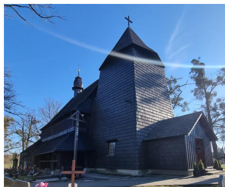
Fotografia 3. Widok na Kościół parafialny pw. Św. Katarzyny Aleksandryjskiej w Sierakowicach.

Kościół zbudowany w latach 1776-1777, XVIII w., odnawiany w latach 1905-1906 oraz 1937-1938. Kościół jest świątynią salową, na rzucie prostokąta, z węższą od nawy, trójboczną apsydą, umiejscowioną po stronie wschodniej. Nawa nakryta jest dachem dwuspadowym, nad apsydą znajduje się dach trójspadowy. Od strony północnej usytuowana została