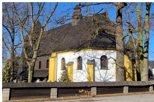
Fotografia 5. Widok na kościół pw. Trójcy Świętej w Rachowicach.

Kościół św. Jakuba Starszego w Sośnicowicach to budowla pochodząca z połowy XIV wieku, która w wyniku późniejszych przebudów uzyskała w dużym stopniu charakter barokowy. W latach 1555-1679 ten parafialny kościół przejęty został przez protestantów, sprowadzonych na te tereny i popieranym przez ówczesnych właścicieli Sośnicowic, panów Trach von Brzezic. Potem kościół św. Jakuba Starszego powrócił do rąk katolików. W 1780 roku świątynia strawiona została przez pożar. W latach 1786-94 nastąpiła odbudowa, dokonana z inicjatywy hrabiego