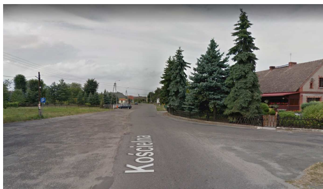
Turze, ulica Rudzka i Kościelna