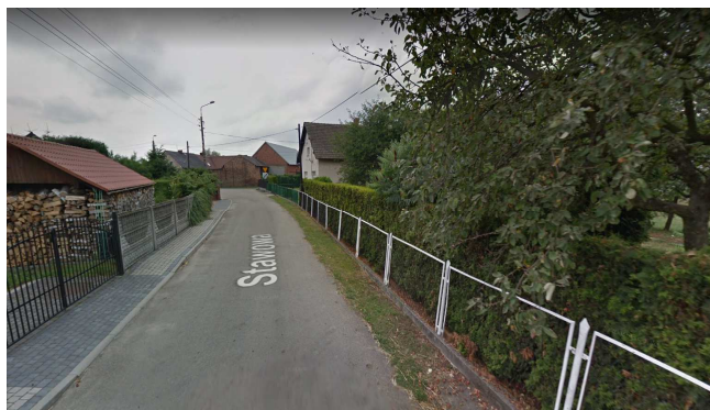
Turze, ulica Stawowa

„Budowa sieci gazowej średniego ciśnienia”, przewidzianej do realizacji w miejscowości Turze, przy ulicach Rudzkiej, Kościelnej i Stawowej , na działce nr 474 i części działek nr 465, 447, 430, 578, 583, 513, 181/3, 562, obręb ew. Turze 0008