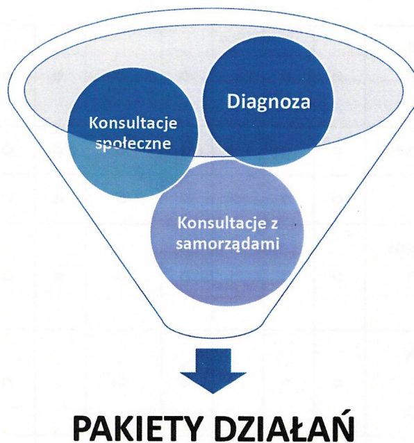
Rysunek 2 Proces definiowania pakietów działań