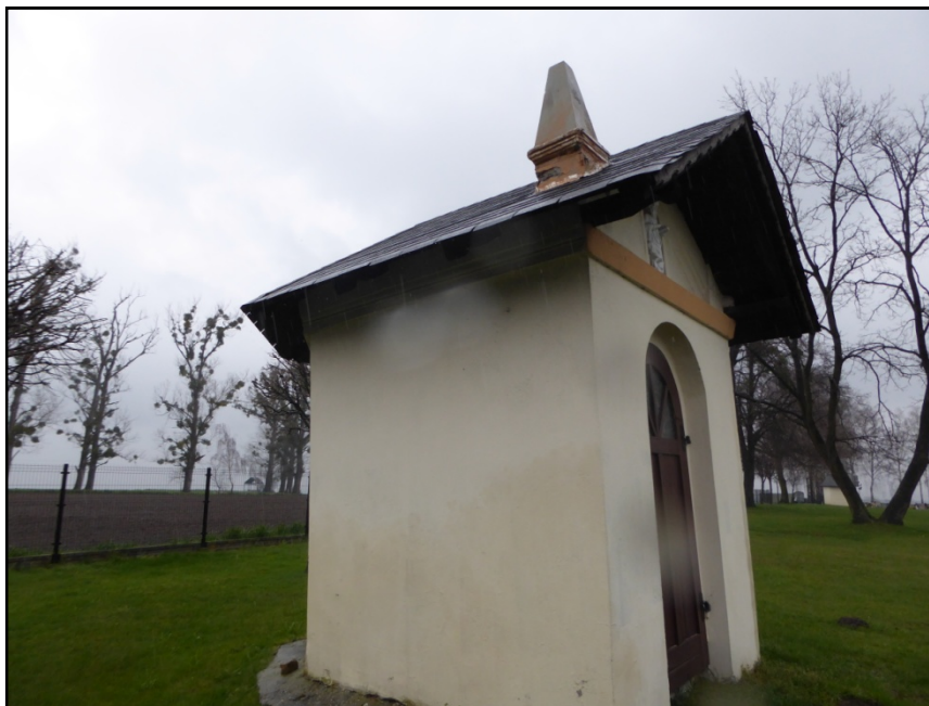
Fot. 4. Elewacja zachodnia