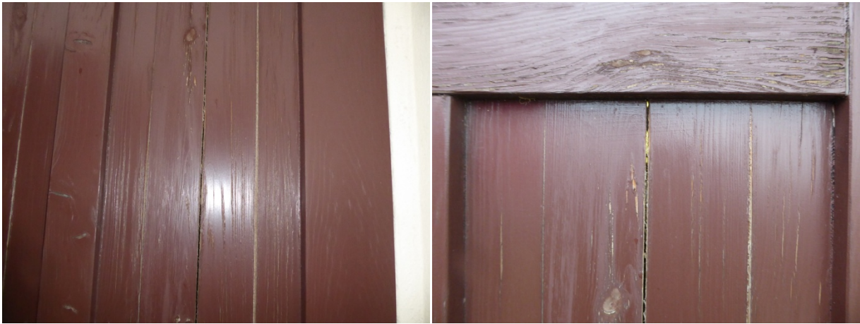
Widoczne miejsca uszkodzeń elementów drewnianych drzwi.