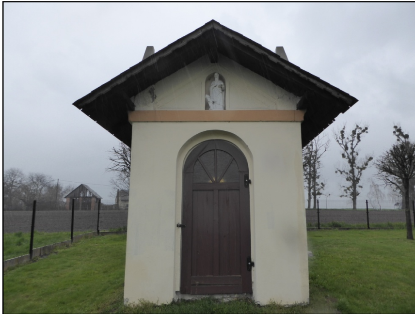
Fot. 3. Elewacja południowa

– osuszenie ścian; remont wnętrza- wymiana tynków wewnętrznych, remont posadzki; odtworzenie ołtarza; zagospodarowanie obiektu, przywrócenie mu dawnej funkcji kultowej - Kaplica Bożego Ciała (PN.-ZACH.) w Sławikowie Fot. 2. Elewacja północna