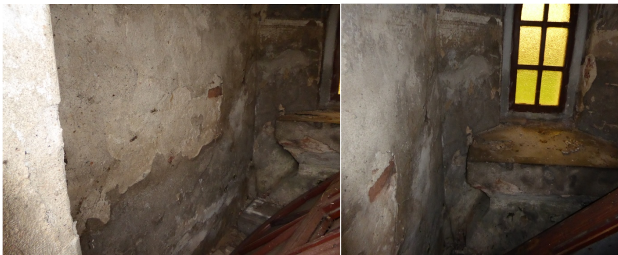
Widoczne miejsca uszkodzeń wnętrza obiektu. Spękania oraz ubytki w tynku. Ślady zawilgocenia w dolnych partiach ścian.

Istniejące tynki wykazują znaczny stopień zużycia oraz destrukcji. Występują liczne ubytki oraz spękania tynku. Na powierzchni tynku występują zabrudzenia, przebarwienia, zawilgocenia.