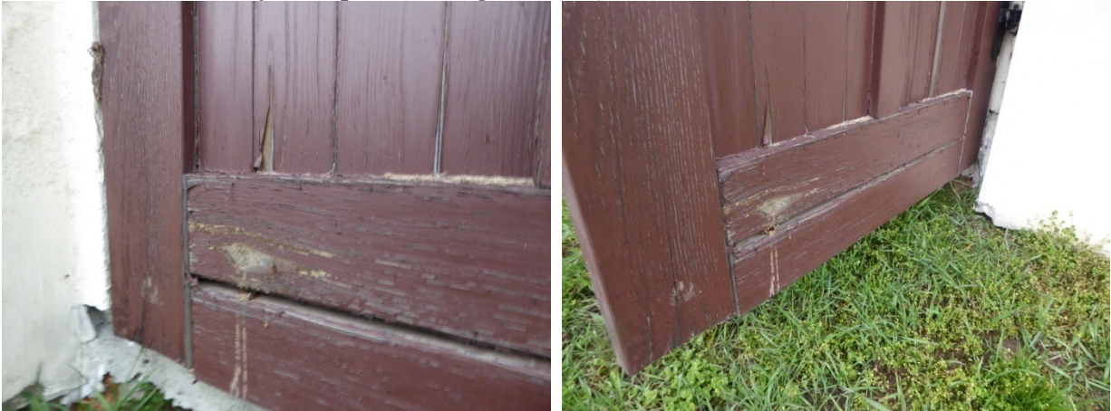
Widoczne miejsca uszkodzeń elementów drewnianych drzwi.

– osuszenie ścian; remont wnętrza- wymiana tynków wewnętrznych, remont posadzki; odtworzenie ołtarza; zagospodarowanie obiektu, przywrócenie mu dawnej funkcji kultowej - Kaplica Bożego Ciała (PN.-ZACH.) w Sławikowie