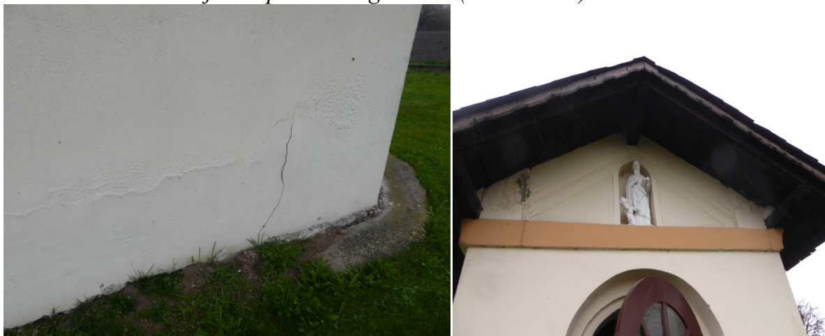
Widoczne miejsca uszkodzeń elewacji.

– osuszenie ścian; remont wnętrza- wymiana tynków wewnętrznych, remont posadzki; odtworzenie ołtarza; zagospodarowanie obiektu, przywrócenie mu dawnej funkcji kultowej - Kaplica Bożego Ciała (PN.-ZACH.) w Sławikowie