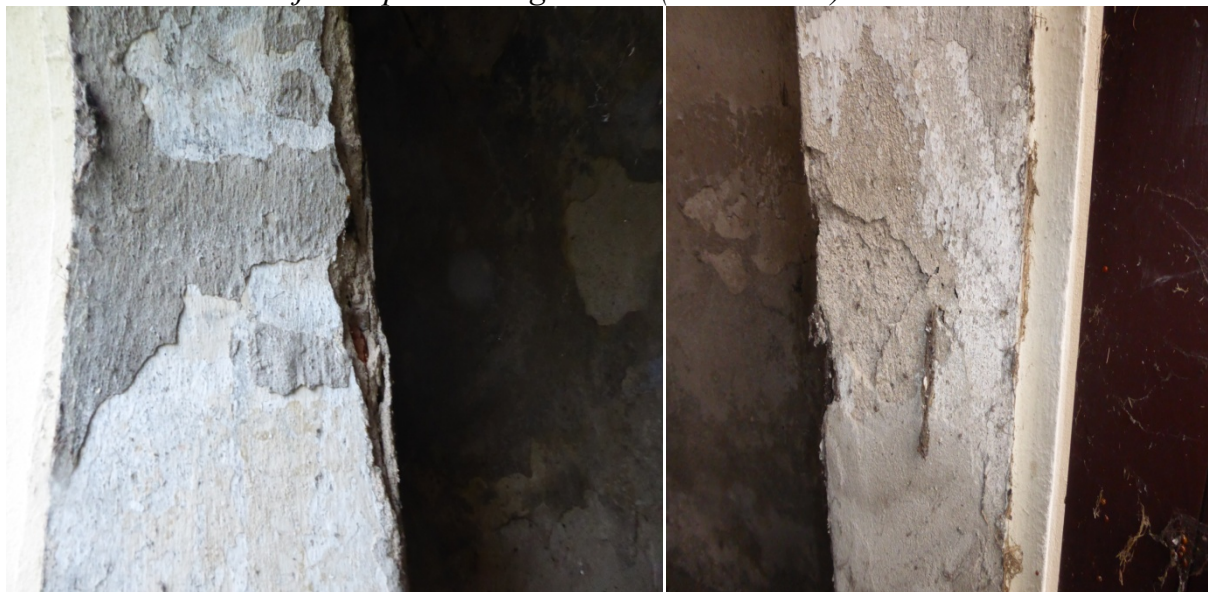
Widoczne miejsca uszkodzeń wnętrza obiektu. Spękania oraz ubytki w tynku.

– osuszenie ścian; remont wnętrza- wymiana tynków wewnętrznych, remont posadzki; odtworzenie ołtarza; zagospodarowanie obiektu, przywrócenie mu dawnej funkcji kultowej - Kaplica Bożego Ciała (PN.-ZACH.) w Sławikowie