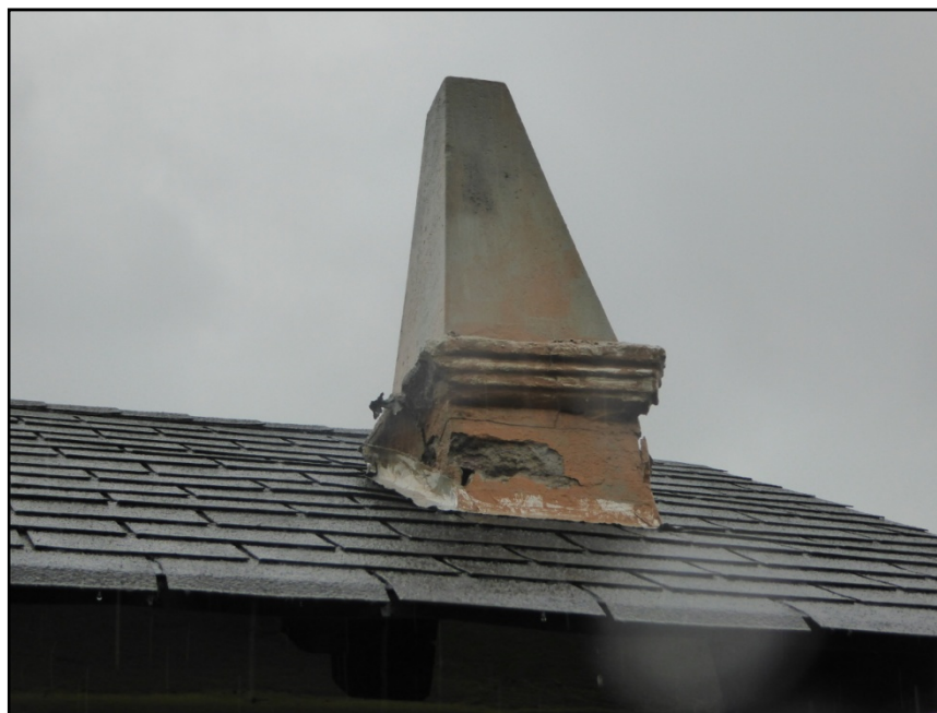
Miejsce ubytki tynku w obeliskach.

Destrukcja pokrycia dachu, widoczne luźne elementy, spękania dachówek bitumicznych oraz ubytki. Uszkodzone opierzenie wokół obelisku. Destrukcja oraz ubytki tynku na obelisku. Częściowo zapadnięta połać dachu wokół obelisku, spowodowana działaniem wilgoci