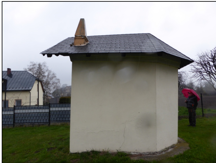
Fot. 1. Elewacja wschodnia

Przedmiotem niniejszego opracowania są zagadnienia związane z planowanym osuszeniem ścian, remontem wnętrza-wymianą tynków wewnętrznych, remontem posadzki, odtworzeniem ołtarza, zagospodarowaniem obiektu. Celem programu jest przywrócenie dawnej funkcji kultowej.