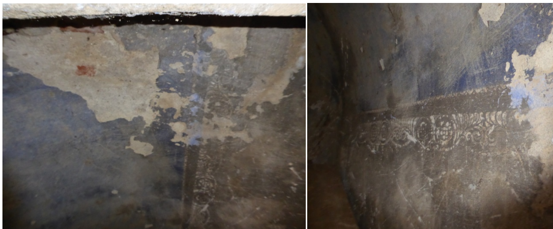
Widoczne miejsca uszkodzeń wnętrza obiektu. Spękania oraz ubytki w tynku.

Istniejące tynki wykazują znaczny stopień zużycia oraz destrukcji. Występują liczne ubytki oraz spękania tynku. Na powierzchni tynku występują zabrudzenia, przebarwienia, zawilgocenia.