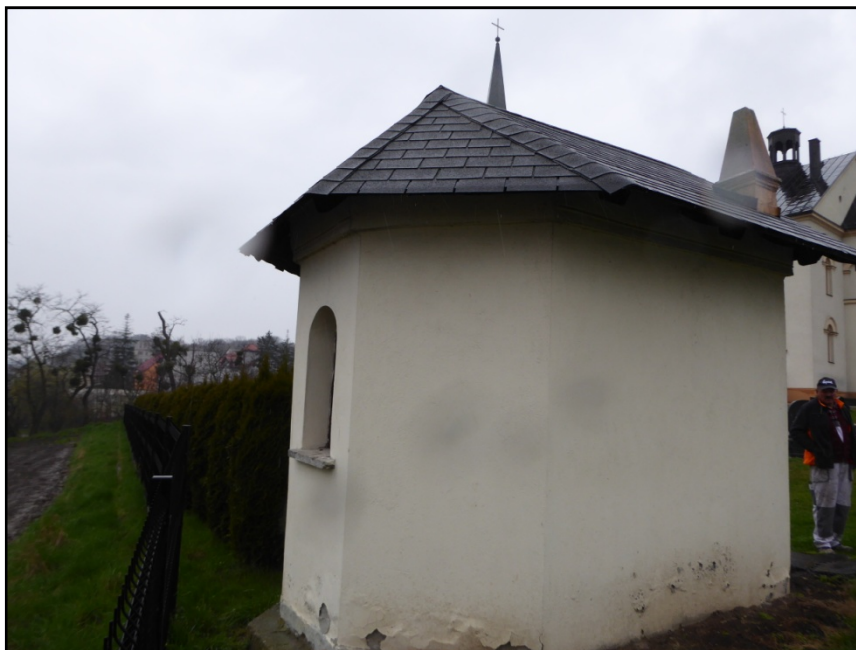
Fot. 3. Elewacja południowa