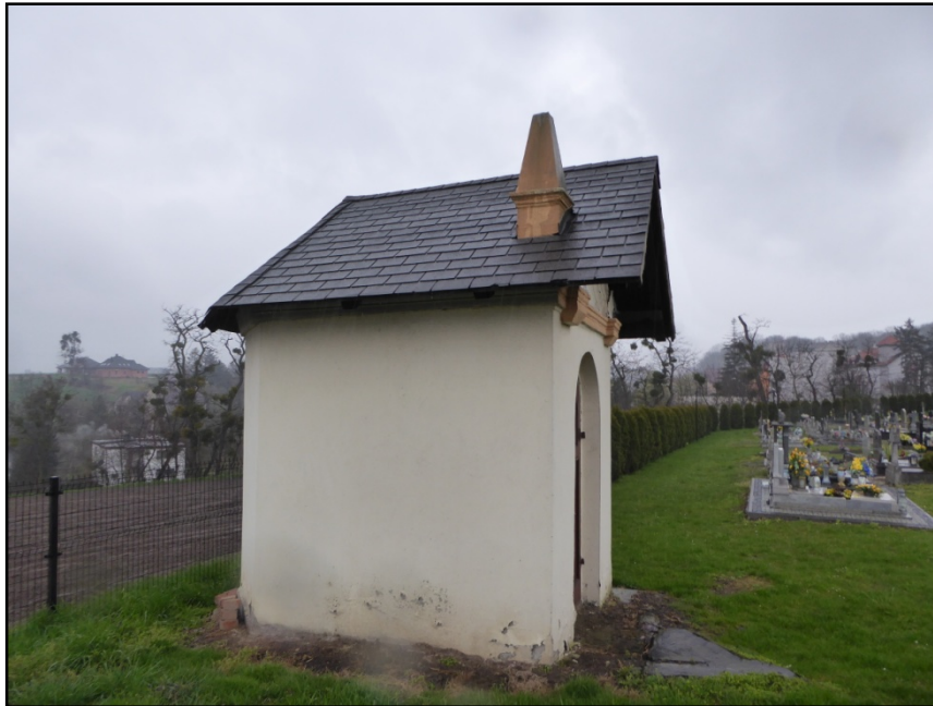
Fot. 1. Elewacja wschodnia

Przedmiotem niniejszego opracowania są zagadnienia związane z planowanym osuszeniem ścian, remontem wnętrza-wymianą tynków wewnętrznych, remontem posadzki, odtworzeniem ołtarza, zagospodarowaniem obiektu. Celem programu jest przywrócenie dawnej funkcji kultowej.