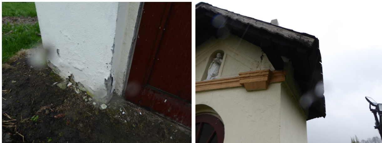
Widoczne miejsca uszkodzeń elementów drewnianych drzwi.