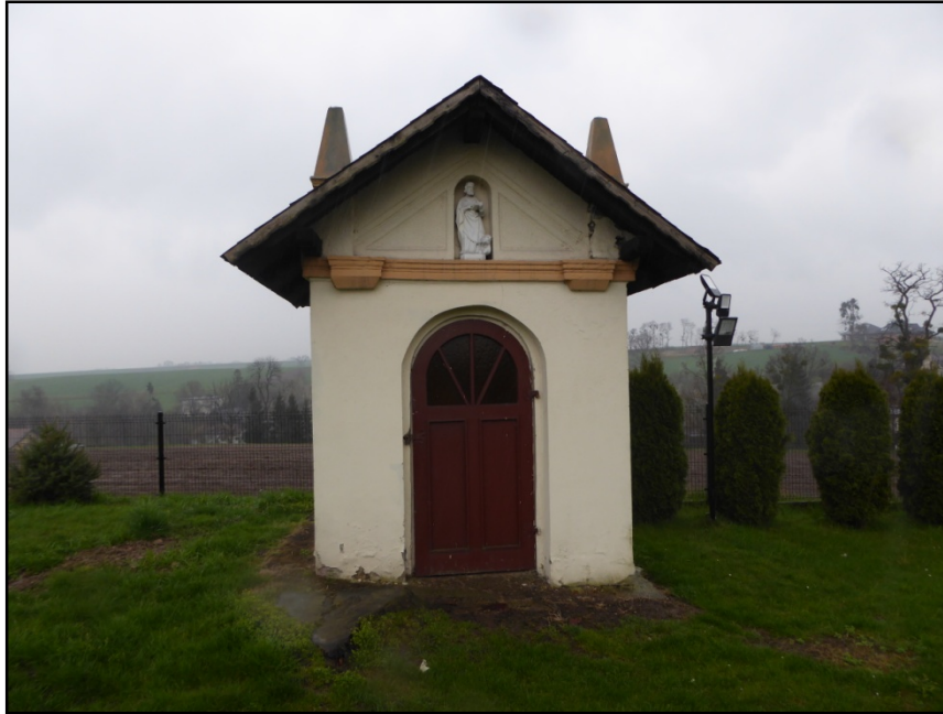
Fot. 2. Elewacja północna

– osuszenie ścian; remont wnętrza- wymiana tynków wewnętrznych, remont posadzki; odtworzenie ołtarza; zagospodarowanie obiektu, przywrócenie mu dawnej funkcji kultowej - Kaplica Bożego Ciała (PD.-WSCH.) w Sławikowie