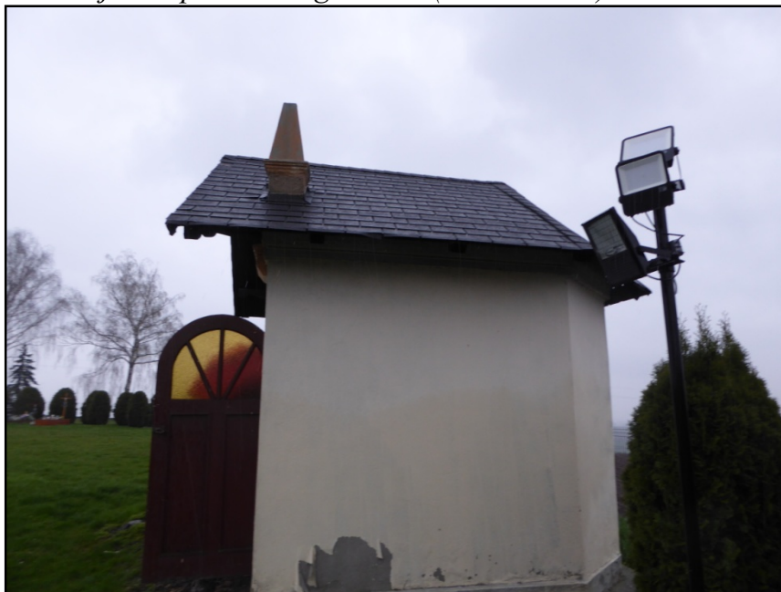
Fot. 4. Elewacja zachodnia

– osuszenie ścian; remont wnętrza- wymiana tynków wewnętrznych, remont posadzki; odtworzenie ołtarza; zagospodarowanie obiektu, przywrócenie mu dawnej funkcji kultowej - Kaplica Bożego Ciała (PD.-WSCH.) w Sławikowie