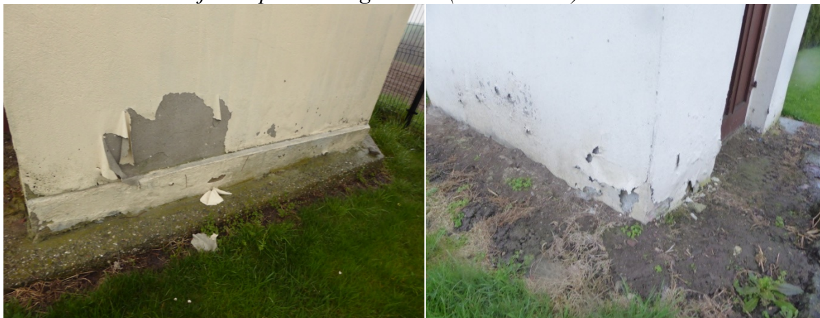
Widoczne miejsca uszkodzeń elewacji.

– osuszenie ścian; remont wnętrza- wymiana tynków wewnętrznych, remont posadzki; odtworzenie ołtarza; zagospodarowanie obiektu, przywrócenie mu dawnej funkcji kultowej - Kaplica Bożego Ciała (PD.-WSCH.) w Sławikowie