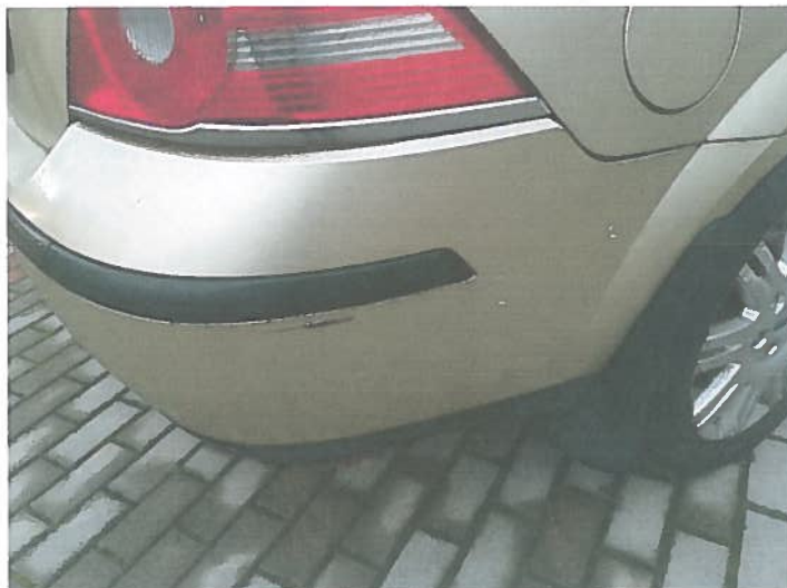
Uszkodzenia zderzaka tylnego.