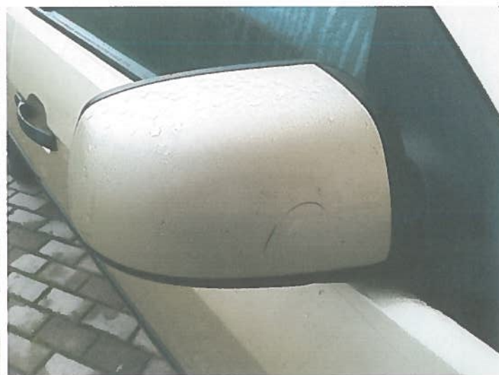
Zarysowana obudowa lusterka prawego.