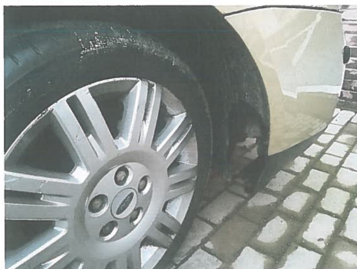
Wyrwana osłona wnętrza koła P.P.