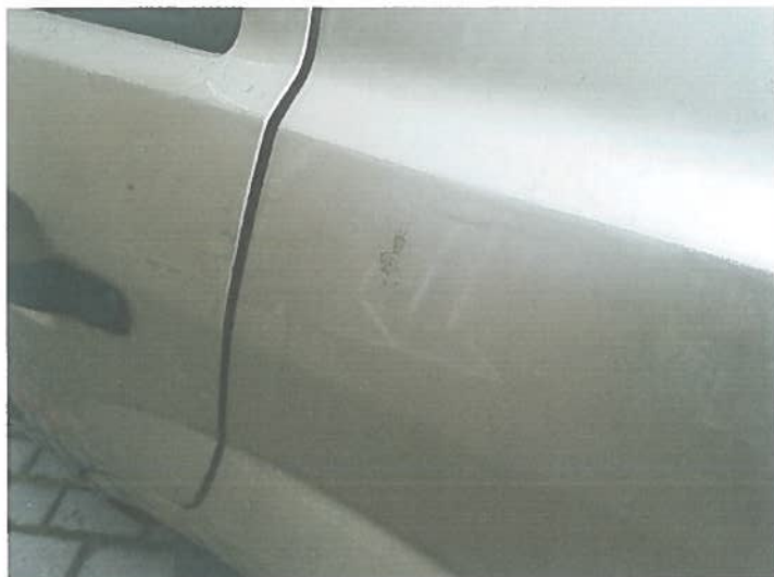
Złuszczenie powłoki lakier. błotn. tyl. lewy.