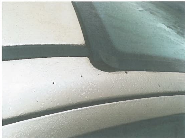
Przełamana listwa prawa szyby czołowej.