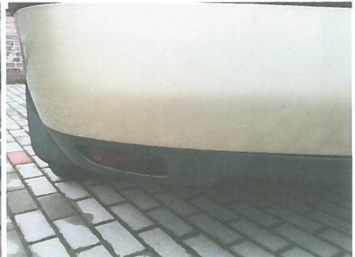
Brak św. odblaskowego tylnego lewego.

RZECZOZNAWCA SAMOCHODOWY Nr ident. Min. Infrastruktury RS 000125