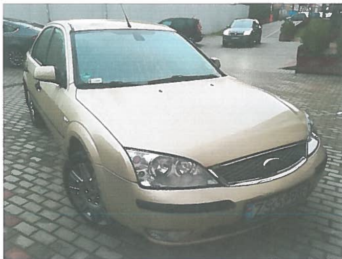
Przód, prawa strona.