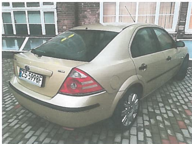
Tył, prawa strona.