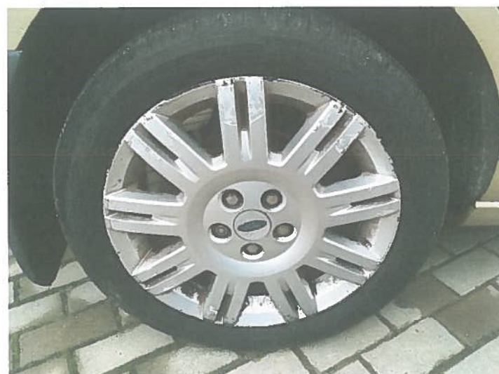
Uszkodzona tarcza koła.