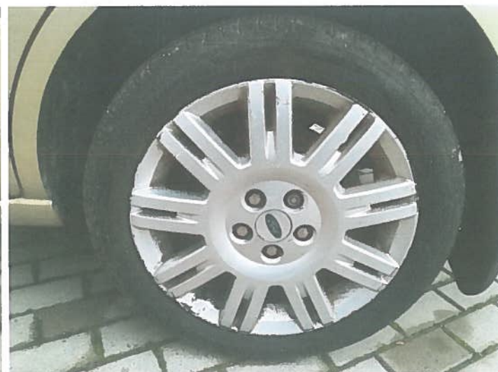
Uszkodzona tarcza koła.