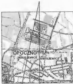
Szkie orientacji Skala 1:25 000