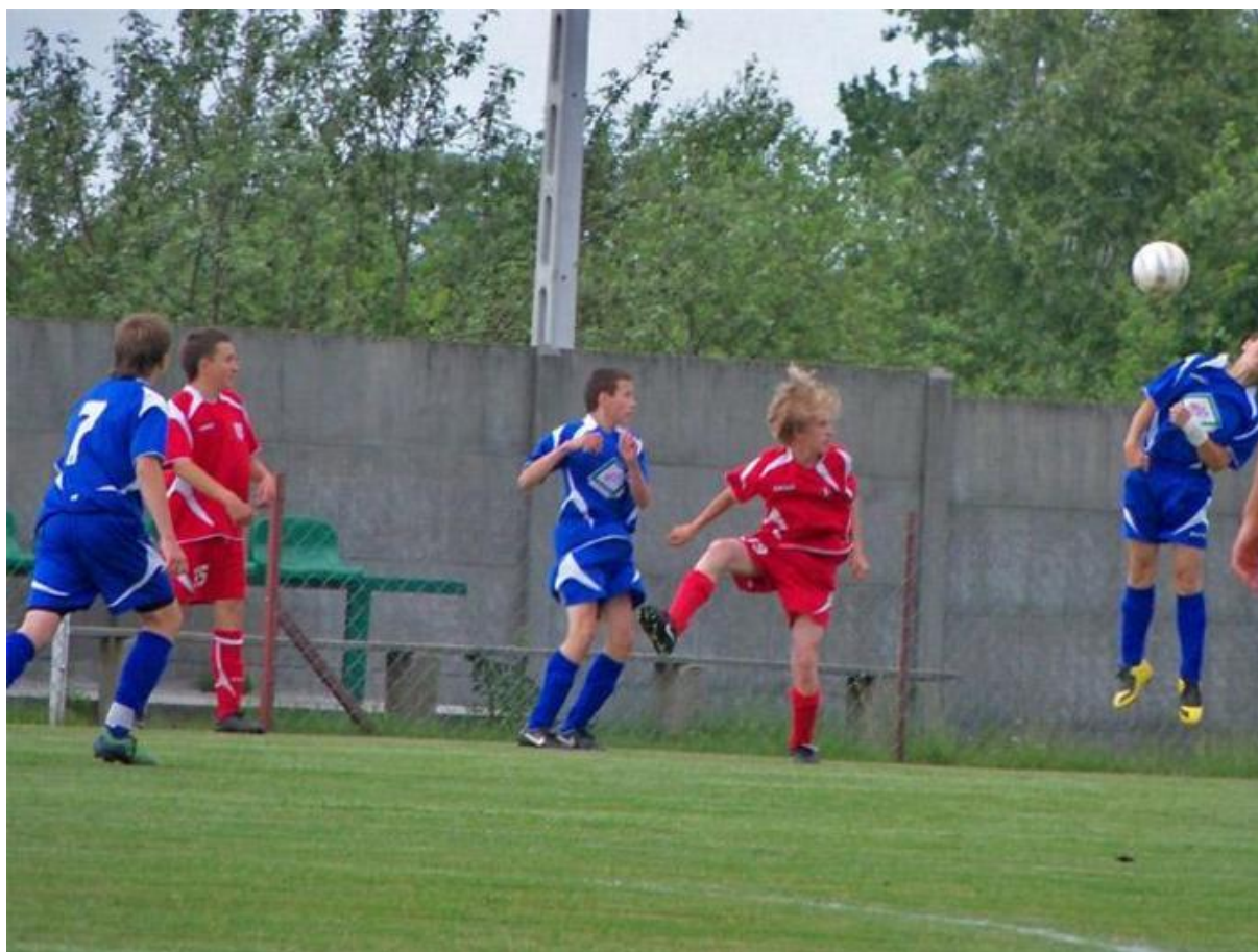
Zdj. 6 Mecz sparingowy Tampkarza Młodszeego na stadionie klubowym

W Bukowcu Opoczyńskim funkcjonuje również organizacja o charakterze sportowym - ZLKS Woy Bukowiec Opoczyński, który powstał w 1995 r., zrzeszająca miłośników gry w piłkę nożną. Funkcjonuje już od 20 lat i obecnie zajęciami sportowymi w zakresie piłki nożnej objęta jest grupa blisko 70 piłkarzy w poszczególnych kategoriach: klasa okręgowa Junior rocznik 1997 i 1998, klasa wojewódzka Junior Młodszy, klasa okręgowa Trampkarz Młodszy rocznik 2002. Sponsorem głównym klubu jest Zakład Handlowo – Usługowy WOJCIECHOWSKI. Treningi klubu odbywają się na stadionie należącym do sponsora głównego min. trzy jednostki treningowe w tygodniu oddzielnie dla każdej z grup przez wykwalifikowaną kadrę trenerską.