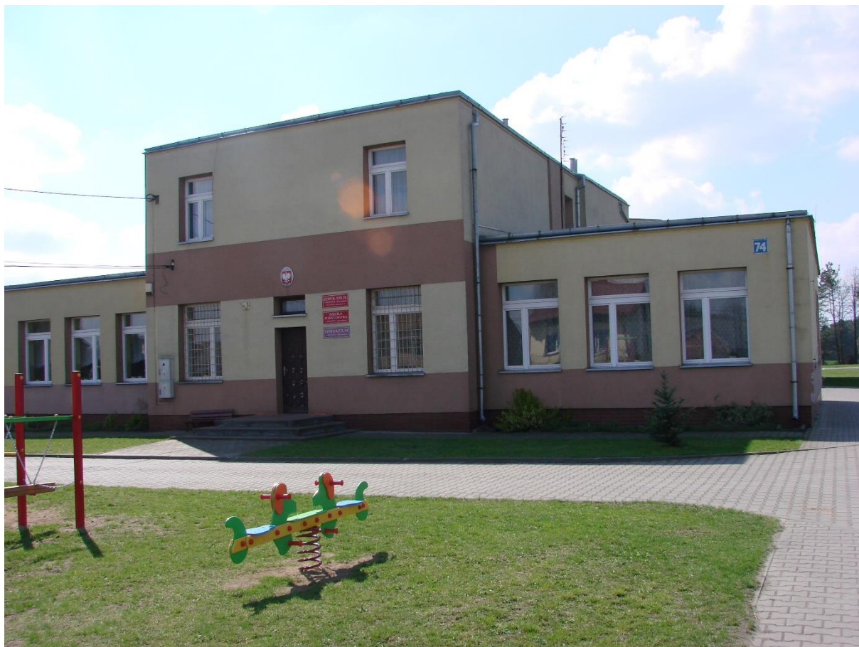
Zdj. 3. Budynek Zespołu Szkół w Bukowcu Opoczyńskim.

Na terenie miejscowości znajduje się świetlica wiejska i biblioteka. Świetlica posiada zaplecze kuchenne. Świetlica wiejska w Bukowcu Opoczyńskim istnieje od 1967 lub 1968 r. W owych czasach, kiedy na wsiach nie było telewizorów, ludzie z całej wsi, nie tylko młodzież i dzieci, schodzili się, by wspólnie oglądać telewizję czy napić się kawy (co było rzadkością w tamtych czasach). W świetlicy odbywały się różne prelekcje. Przyjeżdżali lekarze wszelakich specjalizacji, prawnicy itp. Były rozmaite kursy: kroju i szycia, gotowania i pieczenia, przyjeżdżały różne firmy kosmetyczne i uczyły robić panie makijaż, itp. Aktualnie świetlica zajmuje pomieszczenie po bibliotece. Przychodzą tutaj małe dzieci, które malują, rysują, lepią ludziki z plasteliny. Z młodzieżą organizowane są zajęcia kulinarne, na których robią sałatki, placki, bliny. Chłopcy grają najczęściej w tenisa stołowego albo bilard. Dziewczynki uczestniczą w zajęciach, które prowadzą panie z KGW. Świetlica otwarta jest cztery dni w tygodniu wtorek od 16.00 – 21.00 oraz czwartek – sobota od 16.00 do 21.00. Na świetlicy zatrudniona jest świetlicowa.