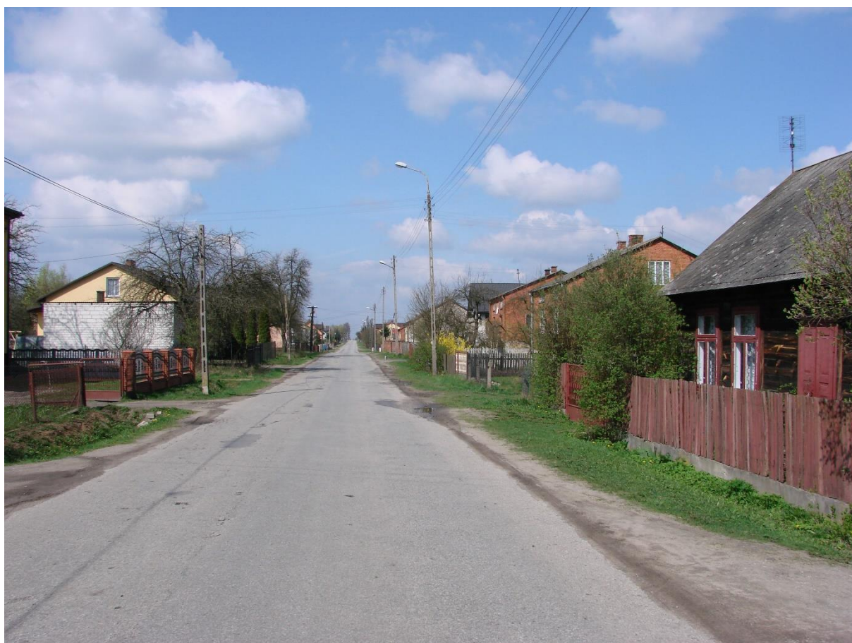
Zdjęcie 1. Widok na wieś Bukowiec Opoczyński

Miejscowość Bukowiec Opoczyński charakteryzuje się układem przestrzennym wsi rządowej, gdzie gospodarstwa i zabudowania skupiają się przy drodze powiatowej nr 3101Ekrzyżującej się z drogą wojewódzką nr 726 łączącą Rawę Mazowiecką z Żarnowem. Cechą charakterystyczną jest układ długich i wąskich, prostopadłych do drogi, w niewielkich odstępach działek.