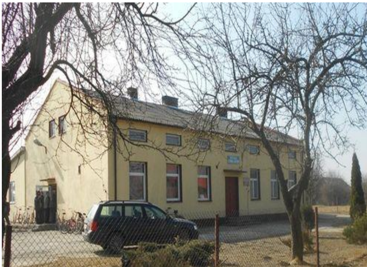
Zdj. 4. Świetlica wiejska w Bukowcu Opoczyńskim.

Na terenie wsi znajdują się obiekty wpisane do wojewódzkiej ewidencji zabytków i jest to 10 chałup z drewna pochodzących z pocz. XX wieku.