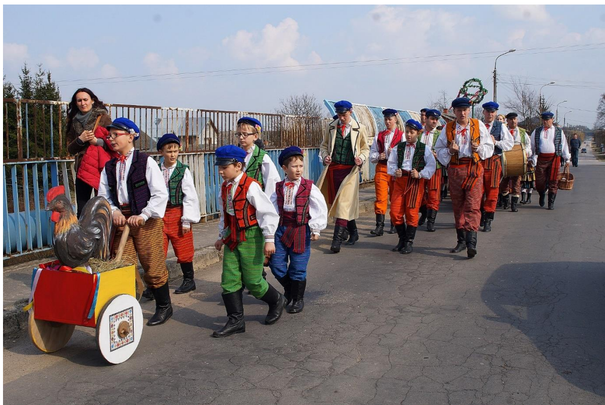
Zdjęcie 2. Tradycyjne chodzenie po dyngusie z galkiem i kogutkiem we wsi Bukowiec Opoczyński.

W Bukowcu Opoczyńskim tradycja ludowa podtrzymywana jest poprzez organizowane różnorodne uroczystości i obrzędy podczas których noszony jest tradycyjny opoczyński strój ludowy.