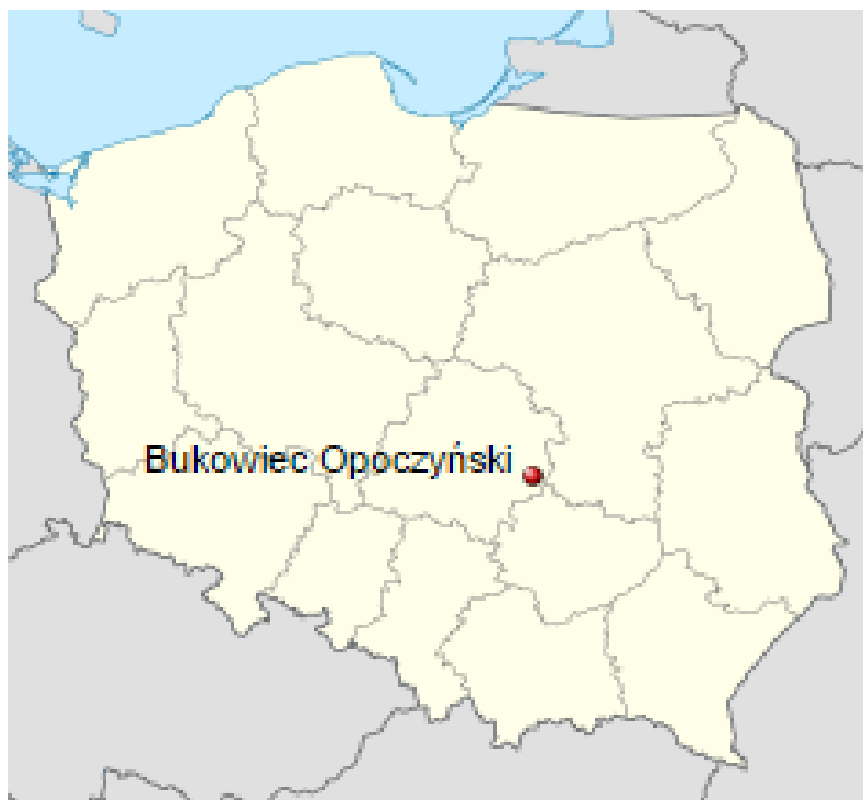
Rys. 1 Położenie miejscowości Bukowiec Opoczyński na mapie Polski