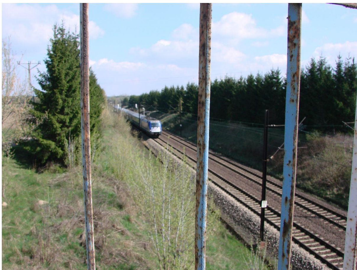
Zdj.5. Wiadukt CMK w Bukowcu Opoczyńskim

W miejscowości znajduje się również obiekt inżynierski tj. wiadukt nad torami CMK.