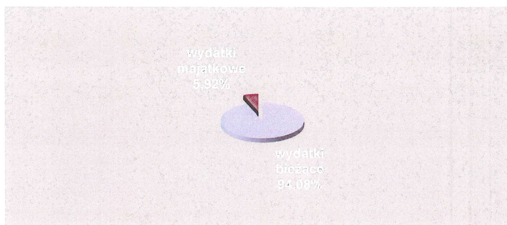
Wykres 2 – podział wydatków na grupy

Planowane wydatki bieżące (bez odsetek i prowizji od kredytów i pożyczek) roku 2017 stanowią kwotę 113.575.241,86 i są na nieco wyższym poziomie planowanych wydatków roku 2016 – o kwotę 6.219.344,04 (według planu na dzień 30.09.2015 r.). Powód tej różnicy opisany wyżej.