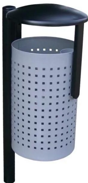
Przykładowa wizualizacja kosza