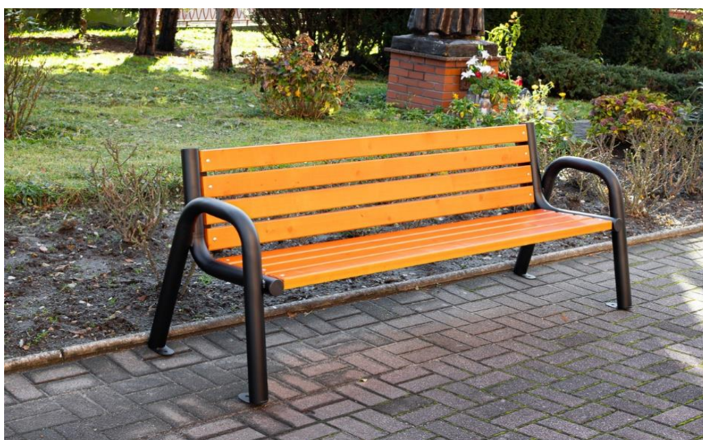
Przykładowa wizualizacja ławki