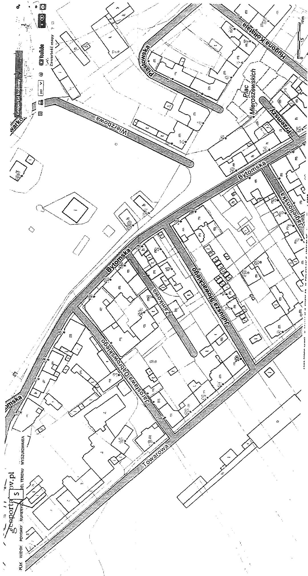
Mysłowice ul. Bytomska 37, 33, 29, 27, 21, 13, 27a, 17-17a, Towarowa 12, 13, Jagiellońska 2, 4, 6, Dąbrowskiego 1

Lokalizacje pomieszczeń węzłów ciepłowniczych