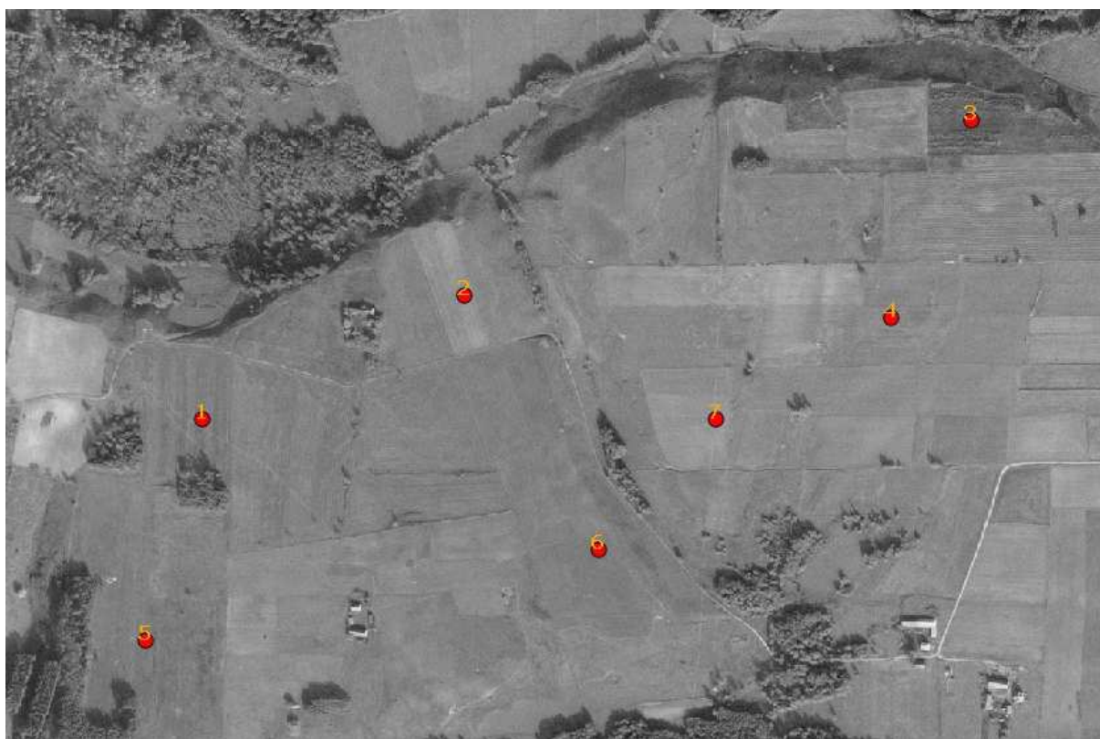
Fot 1.3-1 Orientacyjne usytuowanie turbin wiatrowych

Orientacyjną lokalizację turbin przedstawiono na zdjęciu 1.3-1: