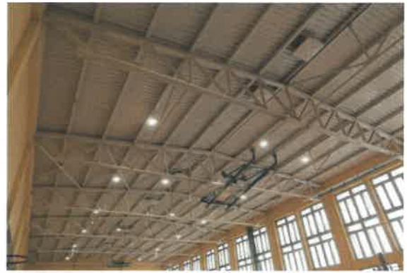
Oświetlenie sal gimnastycznych