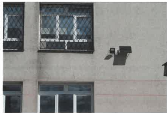
Oświetlenie zewnętrzne – lampy hybrydowe typu LED z panelem solarnym