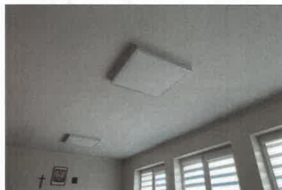
Oświetlenie wewnętrzne – korytarze i sale edukacyjnych – przykładowe lampy