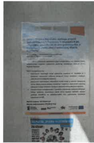
Plakat informacyjny na budynku Przedszkola nr 2