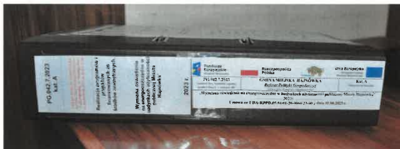
Segregator z przechowywaną dokumentacją projektu