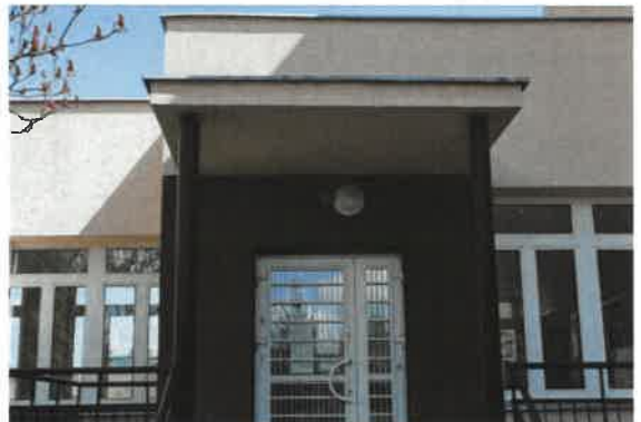
Oświetlenie zewnętrzne – przykładowe lampy