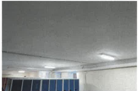
Oświetlenie wewnętrzne zaplecza gospodarczego – przykładowe lampy