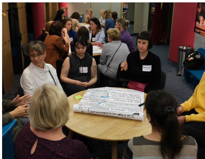
Spotkanie sieciujące WOK