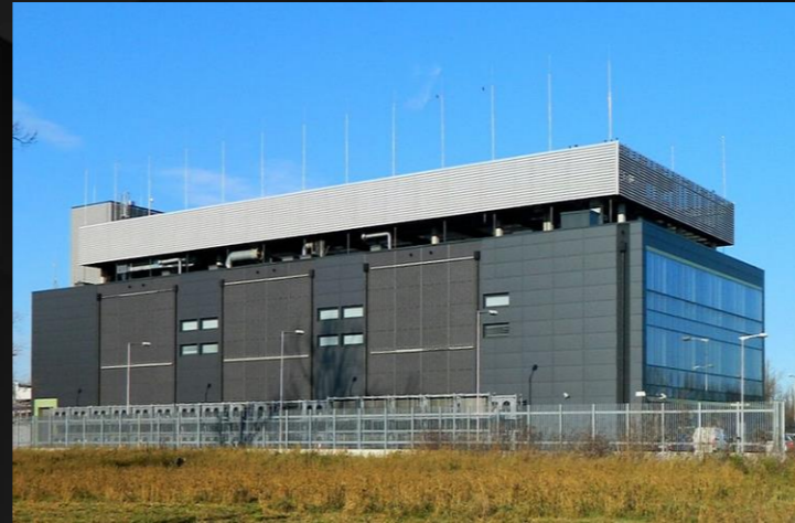
Centrum Danych w Warszawie – Ul. Szlachecka 49