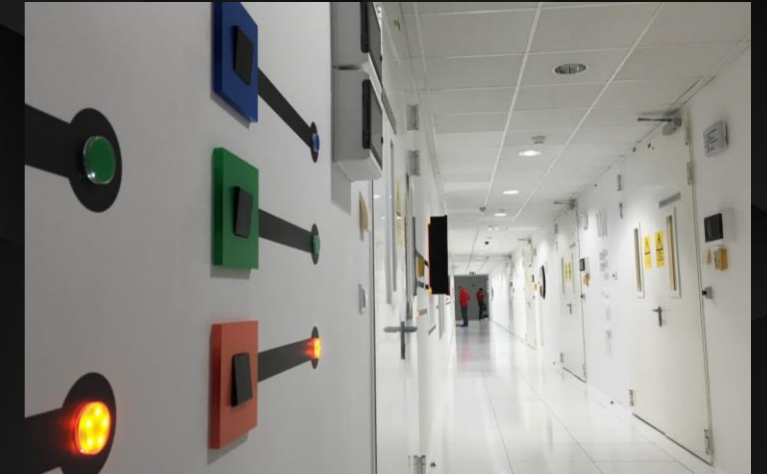
Centrum Danych w Piasecznie – ul. Jana Pawła II 66