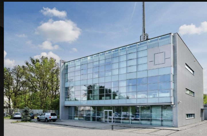
Centrum Danych we Wrocławiu – ul. Na Ostatnim Groszu 116