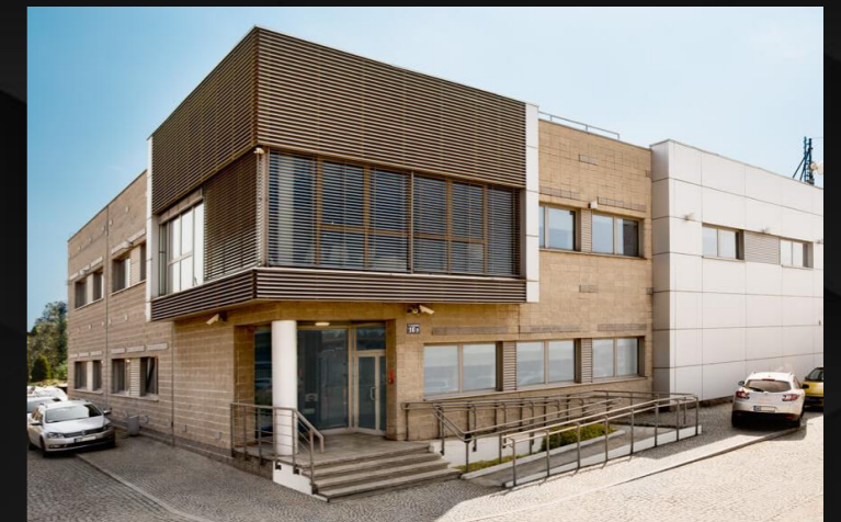
Centrum Danych w Krakowie – ul. Albatrosów 16B