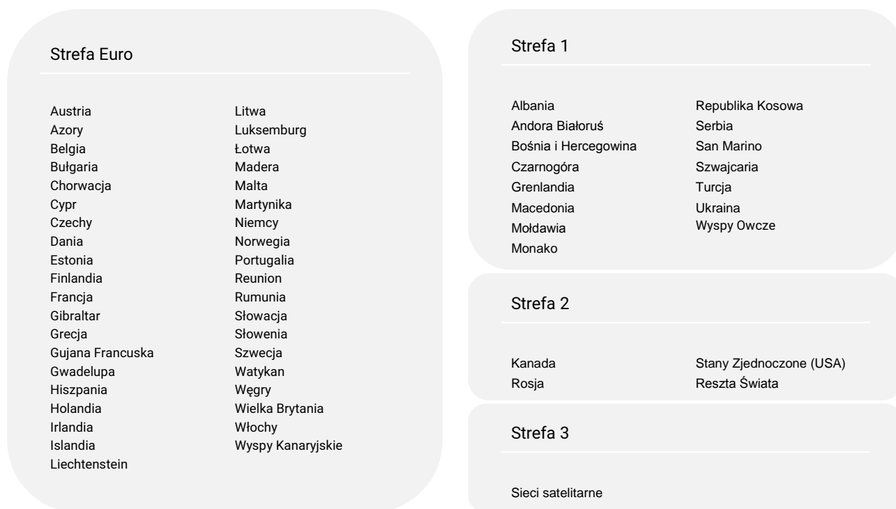
Tabela 10. Opłaty za międzynarodowe połączenia głosowe i połączenia wideo oraz międzynarodowe wiadomości SMS i MMS