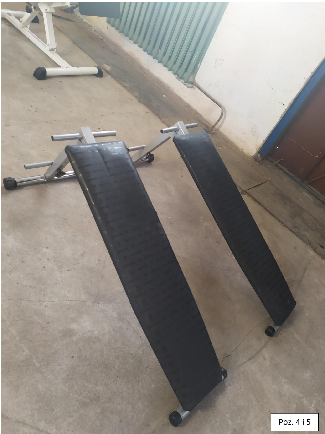
Poz. 4 i 5