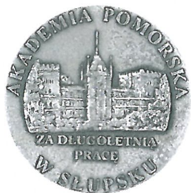
Medal Srebrny „Za Długoletnią Pracę”