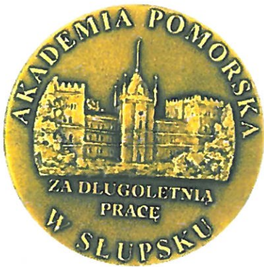
Medal Złoty „Za Długoletnią Pracę”