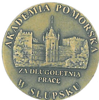
Medal Brązowy „Za Długoletnią Pracę”

Zwyczajowo medal „Za Długoletnią Pracę” wręczany jest w etui o wymiarach 115 mm × 112 mm, obłożonym aksamitem w kolorze ciemnego grafitu. Wewnątrz nad medalem umieszczona jest plakieta mosiężna z nadrukiem: „ W dowód uznania za sumienną długoletnią pracę na rzecz Uczelni – Rektor Akademii Pomorskiej w Słupsku ”.