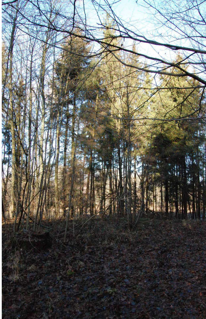
Dzisiaj króluje tutaj przyroda

Jeśli ktoś zawita w ten cichy kawałek naszej małej ojczyzny, niech wspomni o ludziach którzy włożyli w to miejsce swoje serce i pracę, jak niewiele trzeba żeby wszystko zniszczyć i zapomnieć.