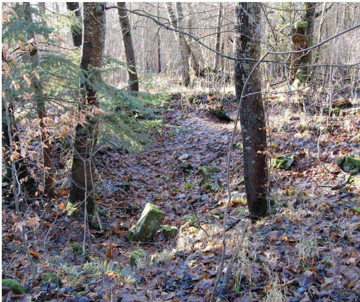
Pozostałości po piwnicach budynku „przeszukane już przez pierwszych miejscowych”