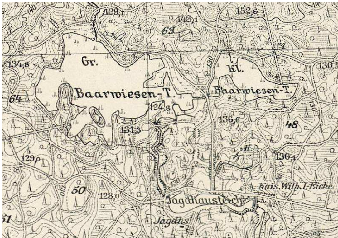
Mapa z 1930-1940 rok z widocznym umiejscowieniem Jagdhaus, Osada Baarwiese niestety już nie istnieje, w prawej części mapy znajduje się Kais. Wilh. I – Eiche ale o tym później.

Na dzień dzisiejszy na terenie oznaczonym jako Jagdhaus niestety nie zostało wiele, poniżej kilka zdjęć z tego miejsca, jest to urokliwe i przyjazne miejsce w którym każdy może przystanąć wyciszyć się i odpocząć.