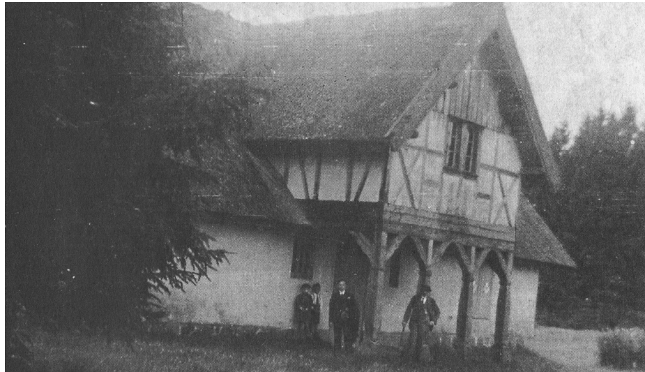
Jagdhaus Baarwiese – rok 1935