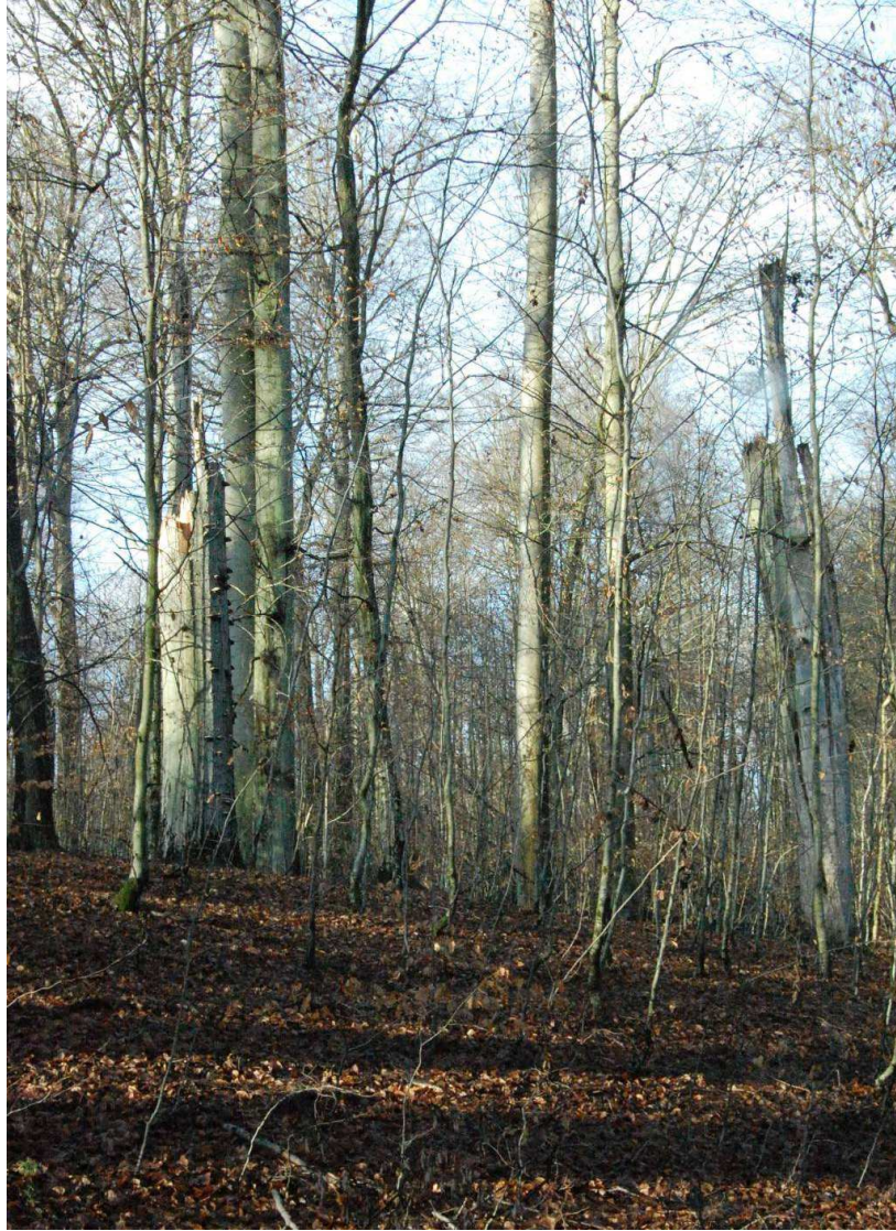
Rezerwat Przyrody drzewostan bez ingerencji człowieka.