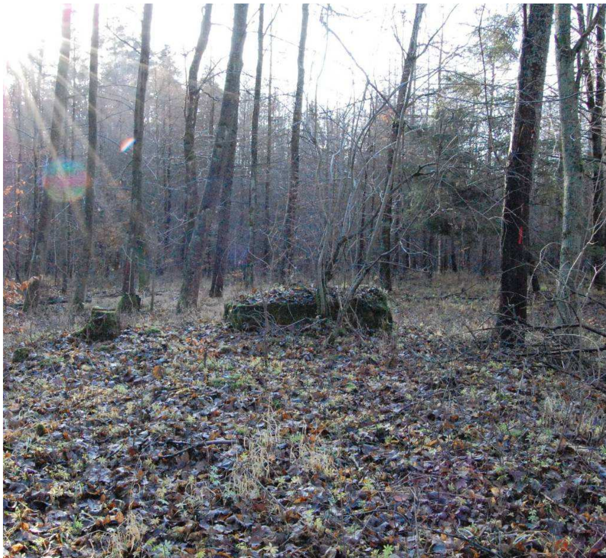
Kawałek ściany z fundamentem świadczy tylko o bytności człowieka.