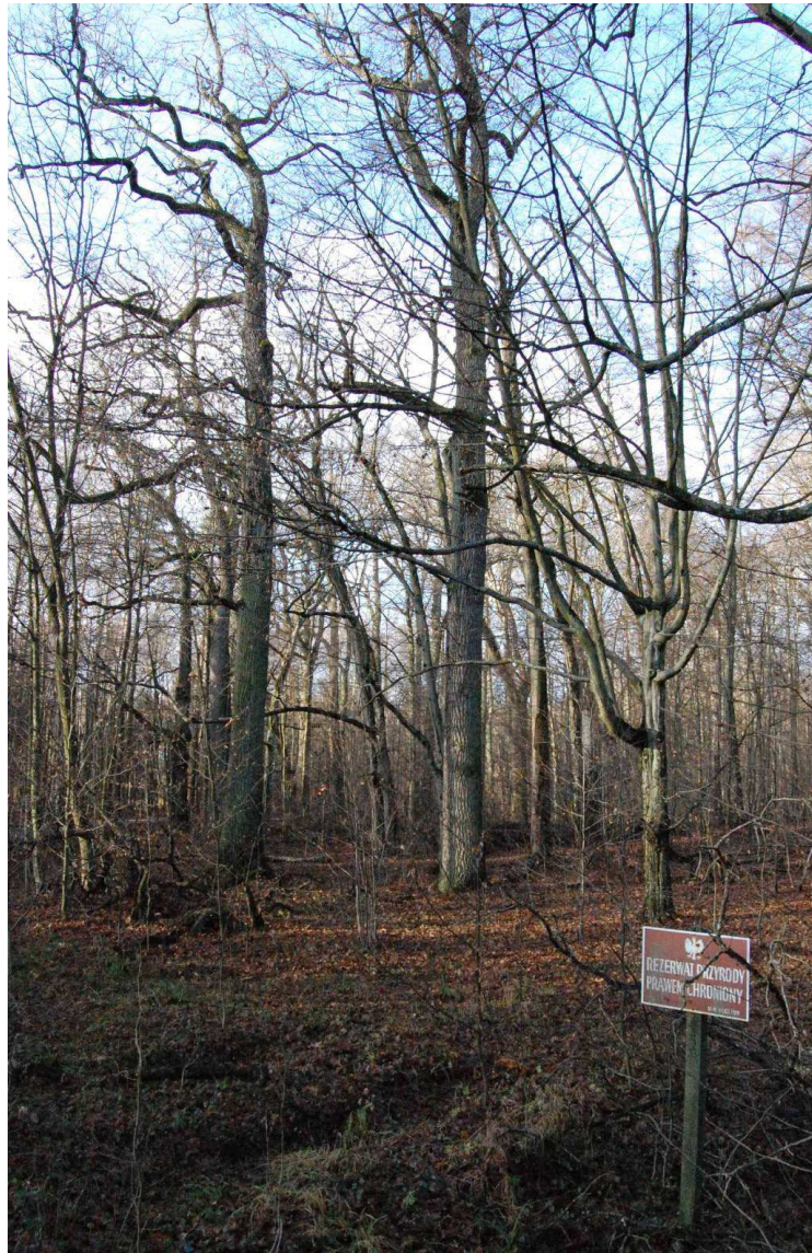
Rezerwat Przyrody Niedźwiedzie Wielkie – od strony stawów hodowlanych.