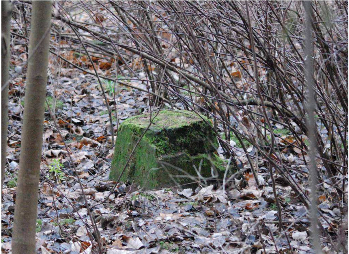
Pozostałości po podporach dachu podcieniowego widoczne na zdjęciu z 1935 roku