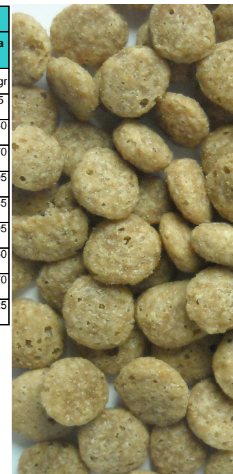
orientacyjna wielkość karmy 1,0 x 01,0 cm